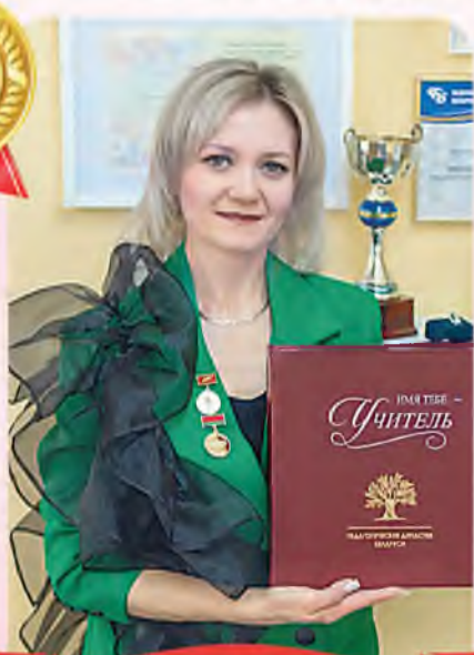
Автор фото: Наталья Чирцо, Минск