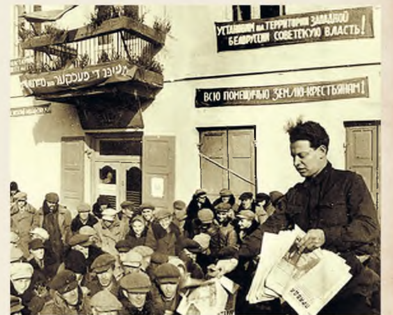
Митинг, посвященный воссоединению Западной Белоруссии с СССР, в Сморгони, 1939 г.

Летом 1929-го из 240 тысяч человек, состоящих в профорганизациях БССР, примерно треть работала на селе. По мере роста числа колхозов значение приобретала помощь города деревне. В декабре того же года Президиум ЦСПСБ рекомендовал каждому профсоюзу выделить лучших труженников предприятий и направить их в колхозы.