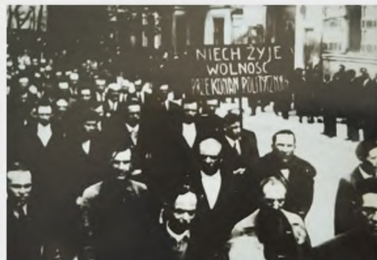
Первомайская демонстрация трудящихся, организованная профсоюзами в Гродно. 1937 год.

В мае 1926 года в Польше произошел государственный переворот под руководством Юзефа Пилсудского, который фактически установил диктатуру. Это послужило началом радикальных реформ, а также агрессивной политики колонизации белорусского населения.