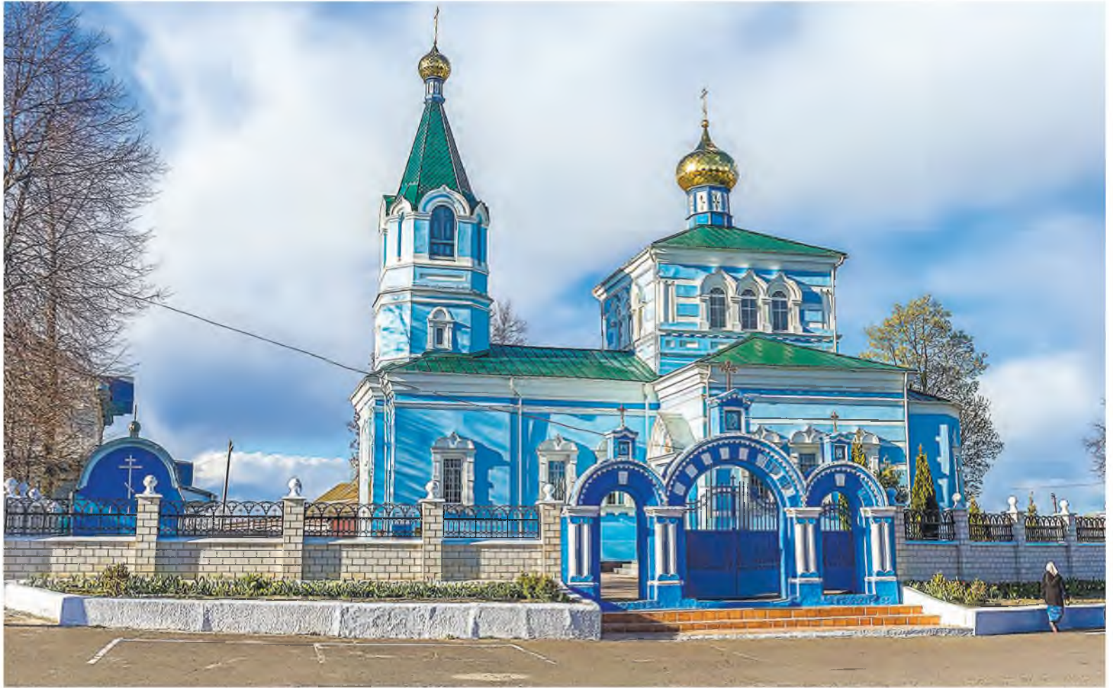
Кормянский монастырь один из самых молодых в Беларуси. Обитель учреждена определением Святого Синода Белорусской православной церкви 8 августа 2000 года. Однако его историческая летопись началась гораздо раньше – в 1760 году.