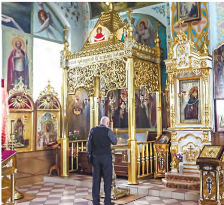
Ежегодно тысячи паломников из разных стран мира приезжают в Корму в поисках чуда. Здесь хранятся нетленные мощи белорусского святого Иоанна Кормянского, которого еще называют заступником гомельской земли.

Иоанн любил повторять слова апостола Иакова: «Вера без дел мертва». Поэтому при жизни он помогал вдовам и сиротам. И не оставил паству после смерти.