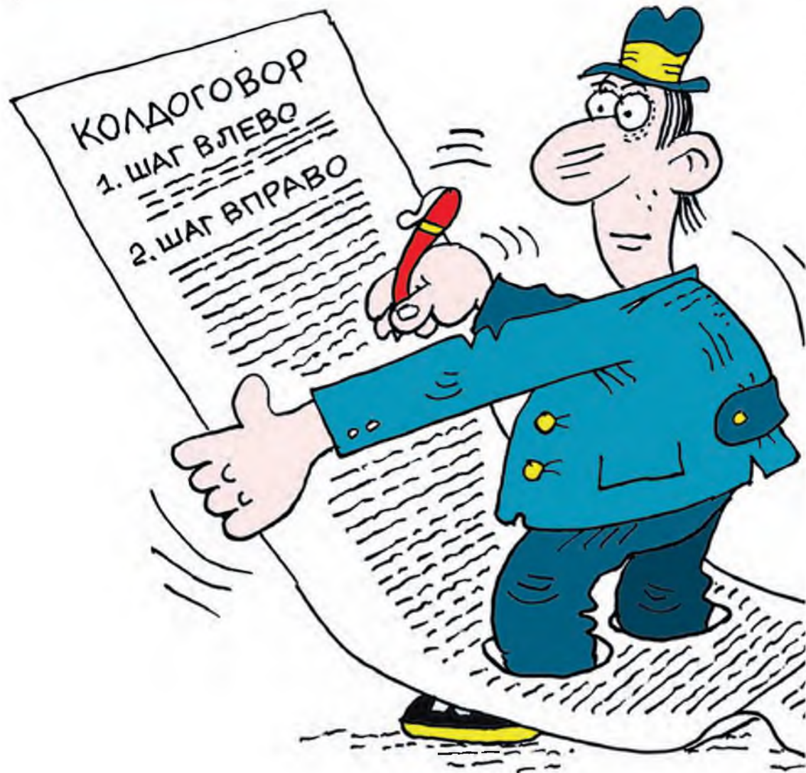
РИСУНОК ОЛЕГА ПОПОВА