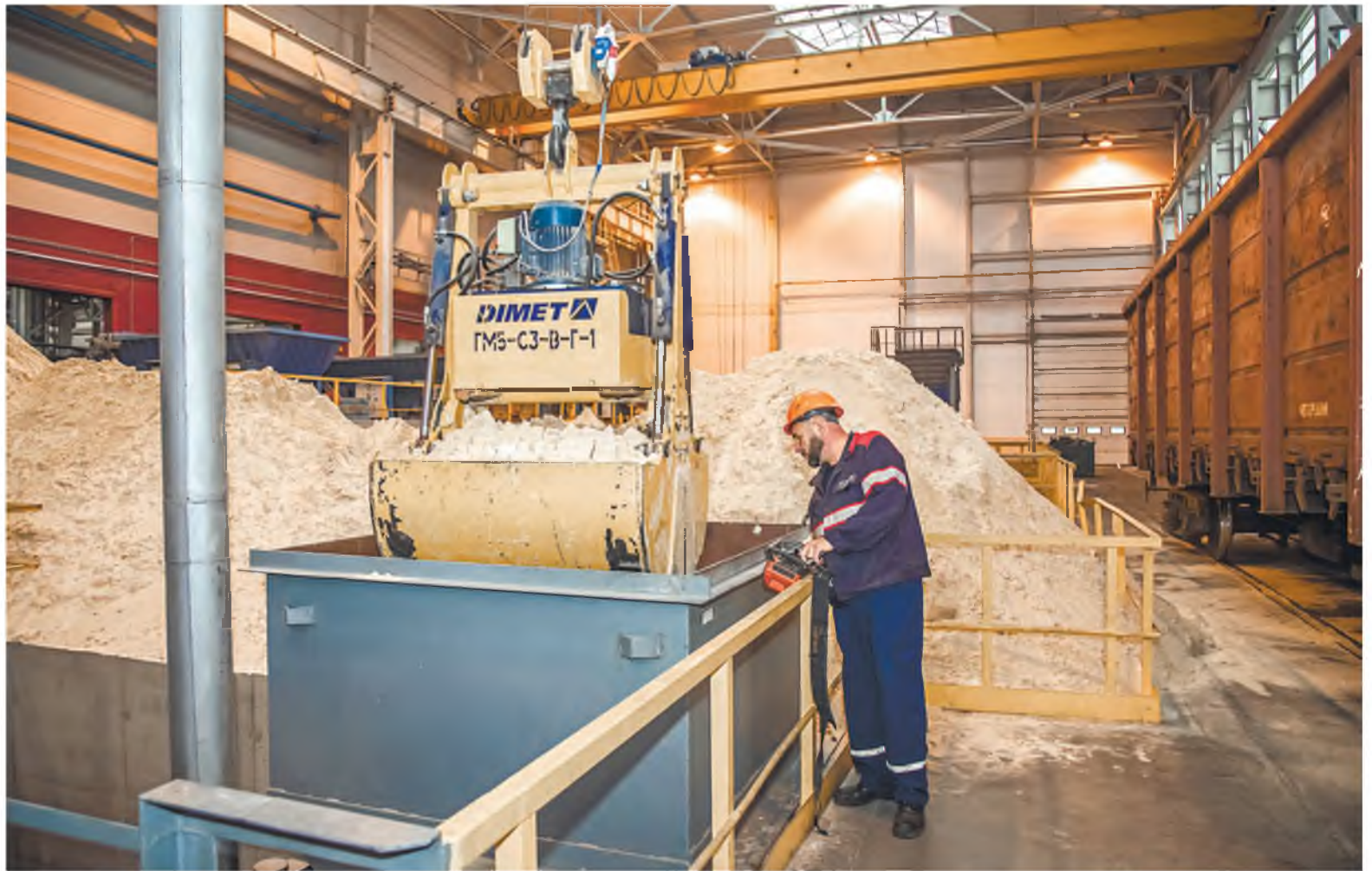
Каждый – от простого работника до руководителя – должен быть заинтересован в том, чтобы соблюдались правила безопасности.

Еще один прорывной момент – предоставление налоговых льгот для молодых специалистов, которые пришли на первое рабочее место по распределению. Профсоюзам удалось добиться введения для них стандартного налогового вычета при уплате подоходного налога. Сегодня он установлен в размере 620 рублей в месяц.