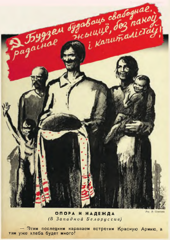
ОПОРА И НАДЕЖДА (В Западной Белоруссии) — Этим последним караваном встретим Красную Армию, а там уже хлеба будет много!

После Освободительного похода Красной Армии в сентябре 1939-го коллективизация проводилась также в Западной Белоруссии. Однако шла она не в таких масштабах и в итоге не была завершена. Процесс прервала Великая Отечественная война.