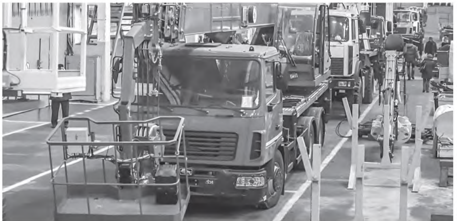
На «Могилевтрансмаше» ежемесячно выпускают не менее 350 единиц техники: с конвейера выходят прицепы, автовышки и многое другое.

родители оплачивали лишь 10% стоимости путевок, а многодетные семьи – 5%.