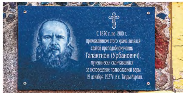
Мемориальная доска у входа в церковь установлена в 2017 году.