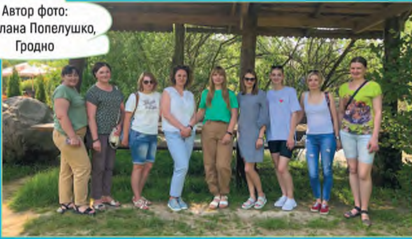
Автор фото: Светлана Попелушко, Гродно