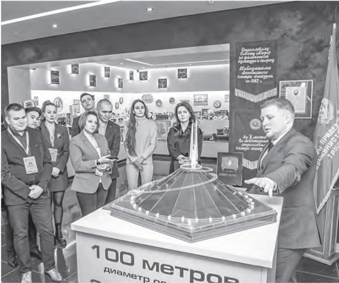
Участники «Маршрута добрых дел» посетили экспозиционно-выставочный центр ФПБ.

К благоустройству воинских захоронений на территории нашей страны подключились молодые профактивисты России, Кыргызстана и Узбекистана: по инициативе Белорусского профсоюза работников здравоохранения проходит акция «Маршрут добрых дел».