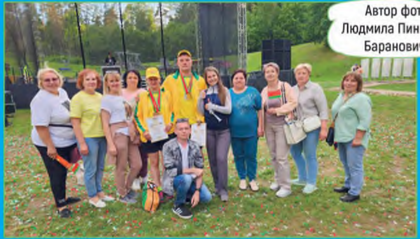
Автор фото: Людмила Пинигина, Барановичи