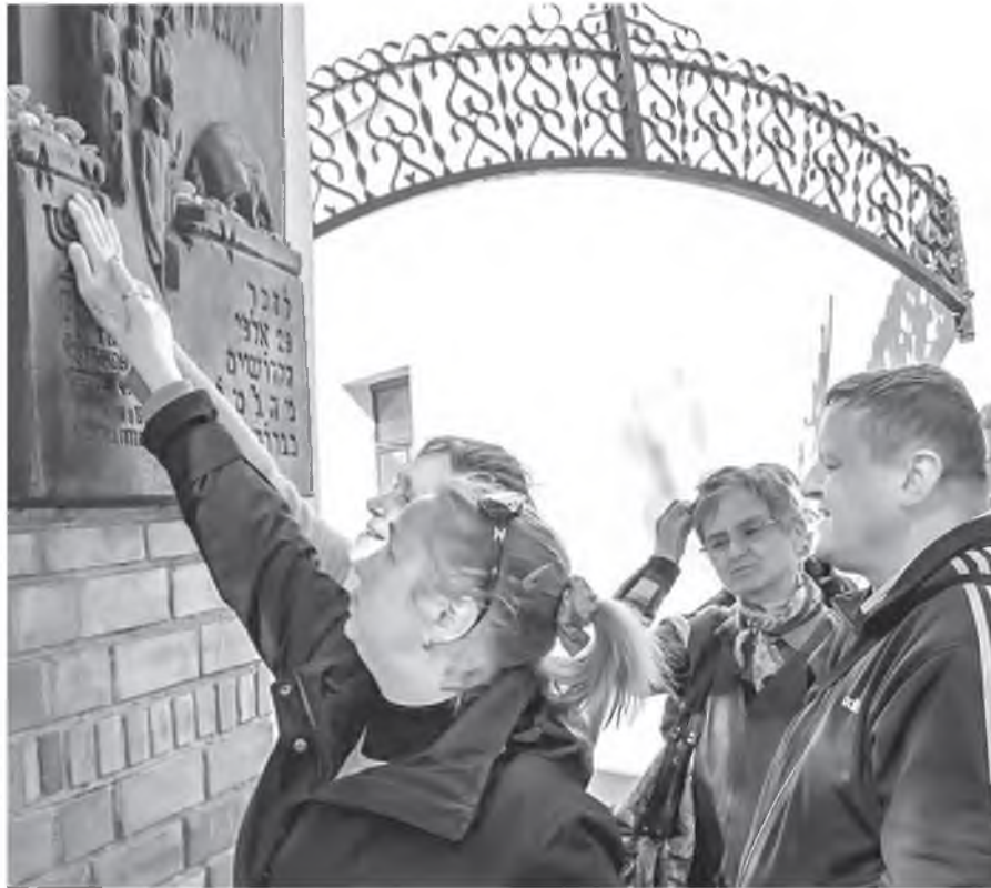
Тактильные экскурсии помогают слабовидящим гродненцам лучше узнать свой город.