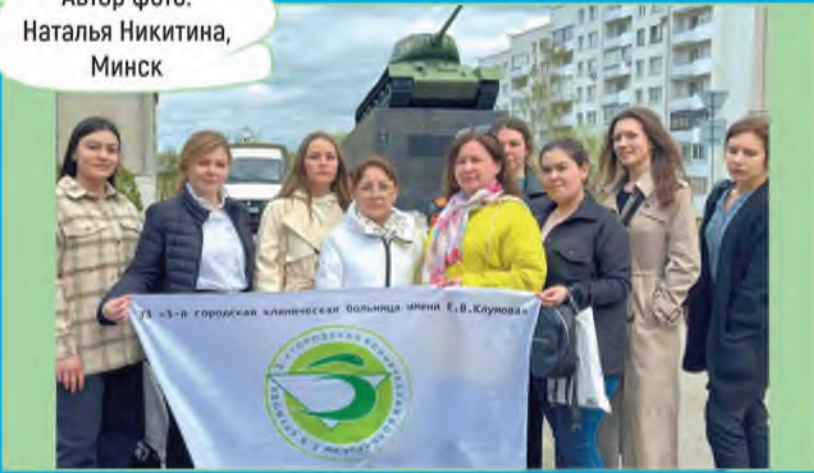
Автор фото: Наталья Никитина, Минск