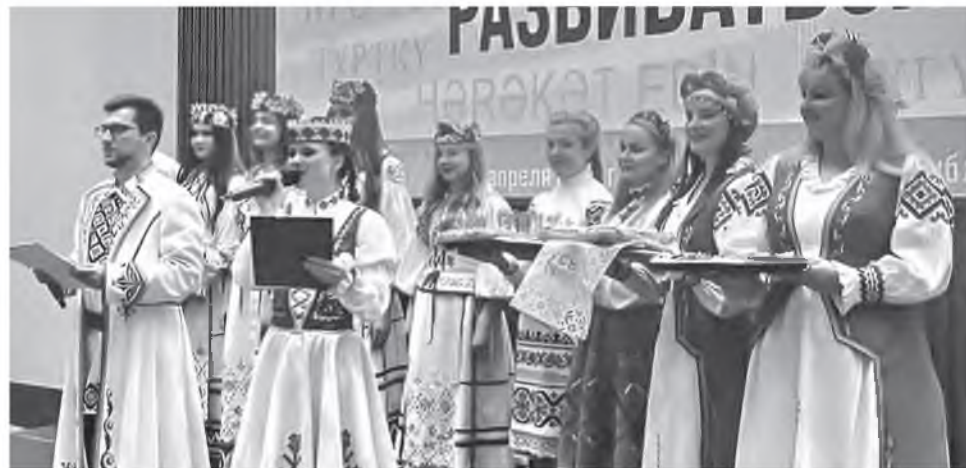
Команда Беларуси поделилась не только опытом работы, но и национальными традициями.

– Наша команда, а это 11 молодых педагогов из всех регионов страны, сделала акцент на направлениях молодежной политики, мотивации и вовлечении молодых людей в активную