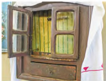
Старообрядческому шкафу для икон, который хранится в историко-этнографическом музее Миор, около 150 лет.