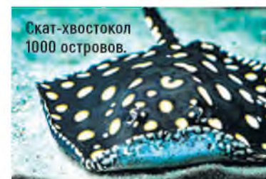
Скат-хвостокол 1000 островов.