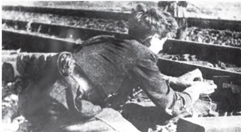
Фото носят иллюстративный характер