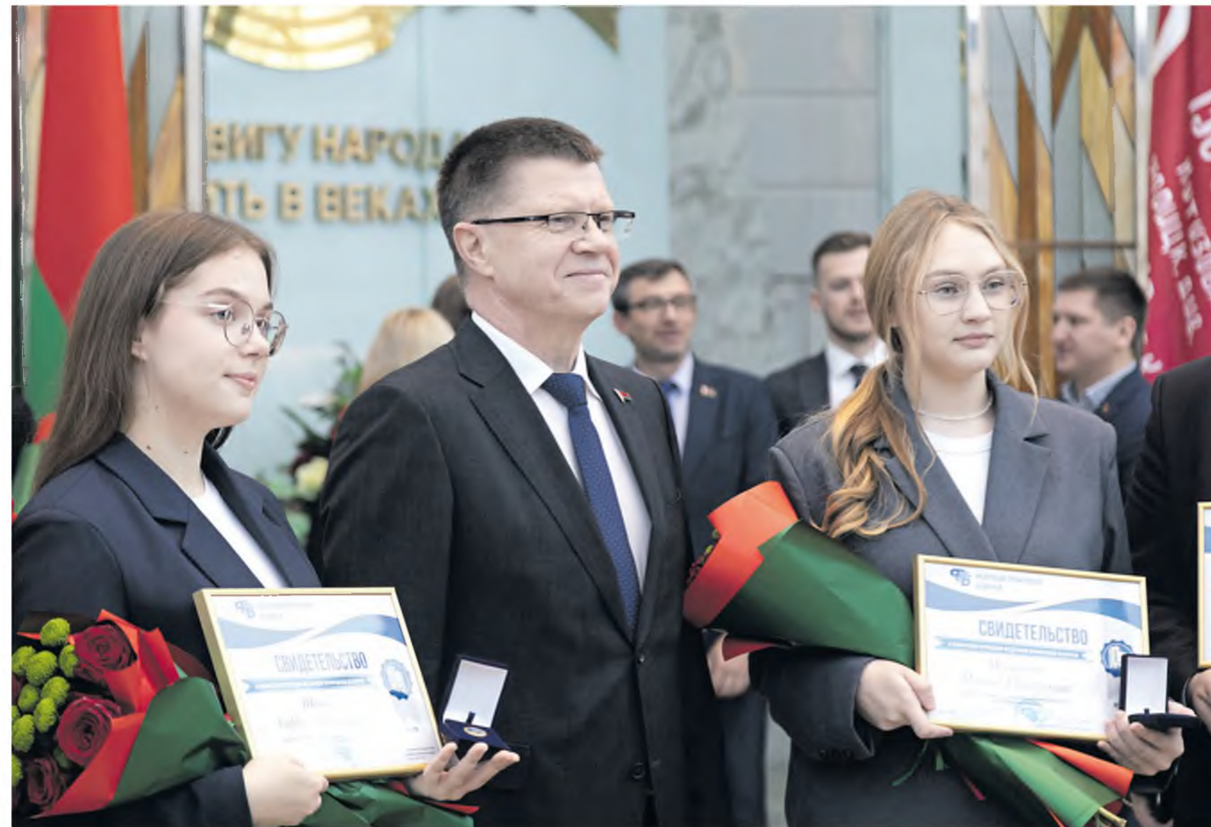
Стипендиатов ФПБ чествовали в Зале Победы Музея истории Великой Отечественной войны. Заслуженные награды ребята получили из рук председателя Федерации профсоюзов Юрия Сенько.

– Профсоюз – это та организация, которая готова помочь в любую минуту и оказать социальную поддержку. Сегодня все это понимают, поэтому у нас стопроцентный охват профчленством. Молодежь активно вступает в организацию и делает это осознанно. Я всегда горел работой с