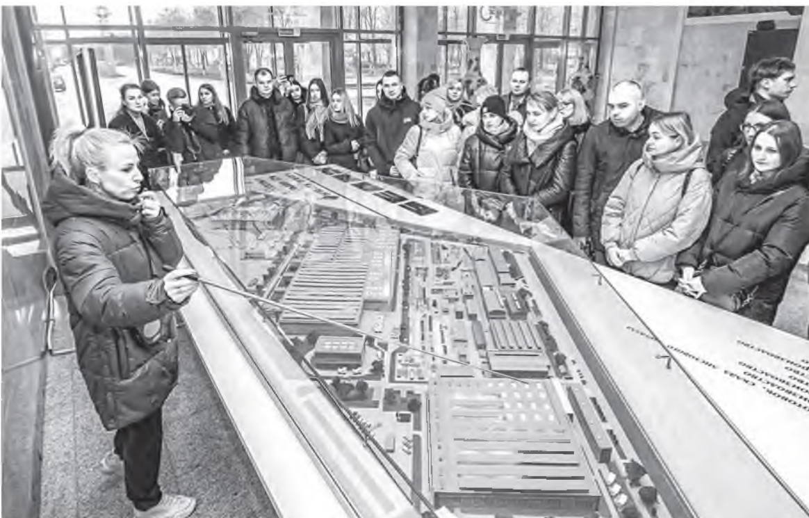
Почти 20% коллектива «БелАЗа» – молодежь до 31 года.