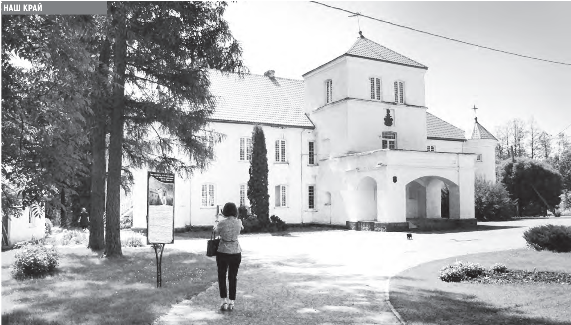
Дом-крепость сменил множество владельцев. В их числе были Хрептовичи, Путткамеры, Остен-Сакены.

История дома-крепости, расположенного в деревне Гайтюнишки Вороновского района, насчитывает более 400 лет. Он выдержал осаду во время Северной войны, уцелел в периоды наполеоновского вторжения и Великой Отечественной. Сейчас в этом здании размещается республиканская психиатрическая больница.