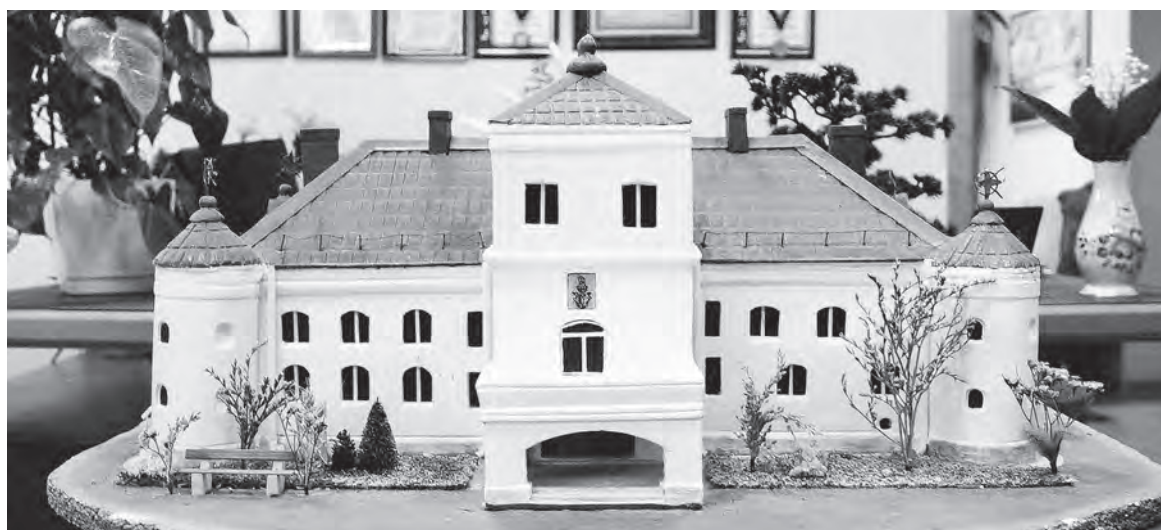
В больнице хранится точный макет дома-крепости, сделанный одним из подопечных учреждения.