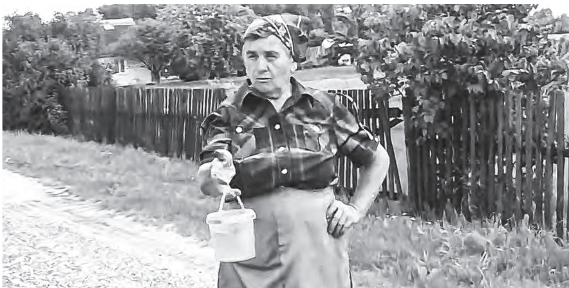
Жители деревни Струга давно страдают от «железной» воды.

Галина СТРОЦКАЯ