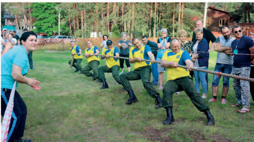
ППО Полесского государственного радиационно-экологического заповедника