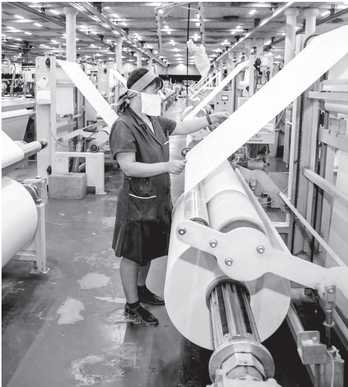
Фото носит иллюстративный характер.

С ноября прошлого года работаю мастером в строительной организации, подписал с нанимателем договор о материальной ответственности. В апреле я принимал отчет увольнявшегося коллеги по факту наличия материала. Выяснилось, что материала нет (согласно отчету его списали), а работы на строительном объекте не выполнены. Могут ли меня привлечь к материальной ответственности в данном случае?