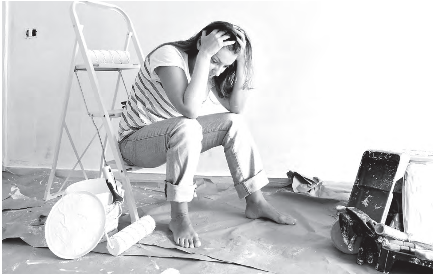
Фото носит иллюстративный характер.