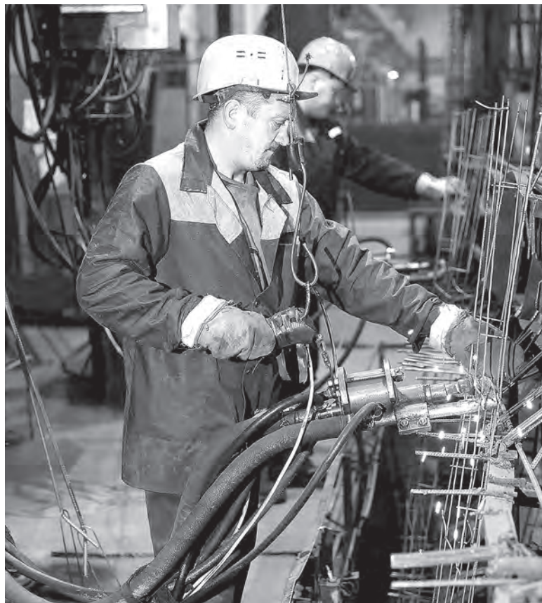
В производственных цехах завода крупнопанельного домостроения Витебского ДСК.

Могут на ДСК похвастаться ветеранами со стажем работы более 50 лет. За верность предприятию колдоговор тоже предусматривает бонусы. При достижении пенсионного возраста (в том числе и за работу с вредными условиями труда) положена единовременная выплата, размер которой зависит от стажа: 1 базовая величина за каждый год на предприятии. По аналогичному принципу рассчитывают размер пособия при уходе на заслуженный отдых. Если работнику исполнилось 50 лет и его стаж на предприятии не менее 3 лет, то к юбилею ему выплачивают 10 базовых.