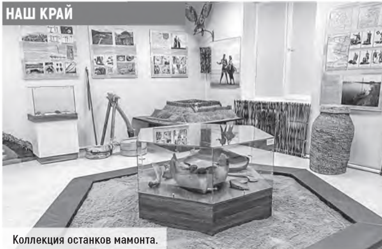
Коллекция останков мамонта.