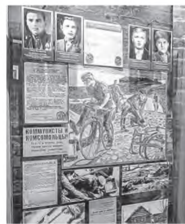
Экспозиция Обольского подполья.