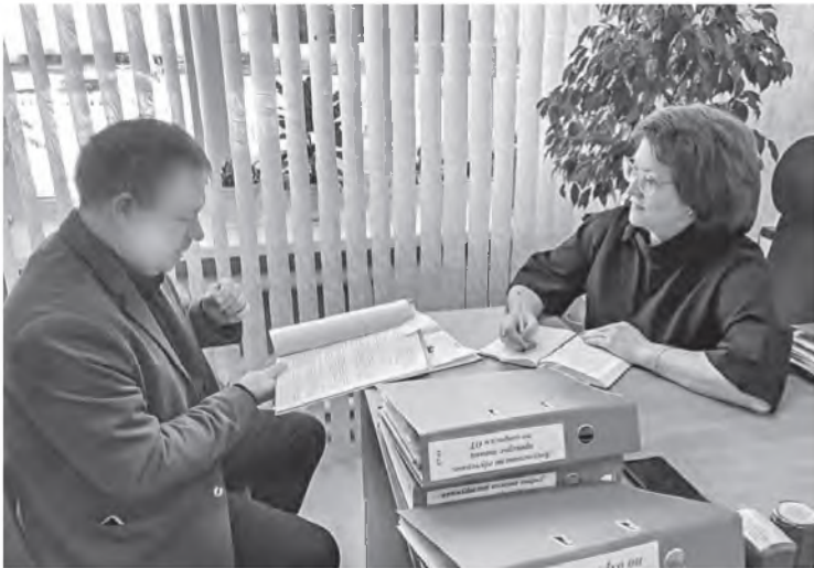
На особом контроле – выполнение норм колдоговоров.

Свыше 16,5 тысячи мониторингов учреждений образования Брестчины в прошлом году провели общественные инспекторы по охране труда отраслевого профсоюза.