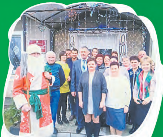
ППО ОАО «Липникский», Брестская обл.