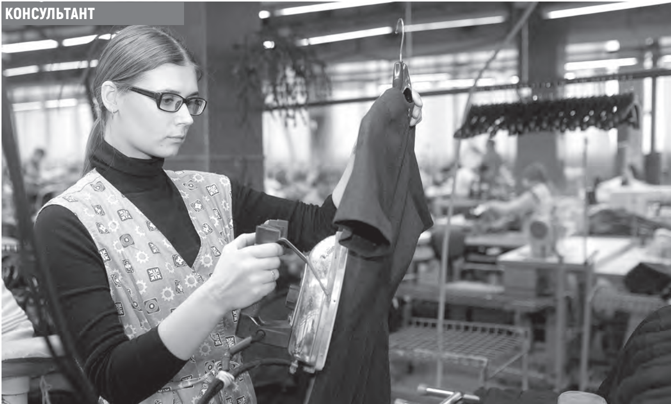
Фото носит иллюстративный характер.