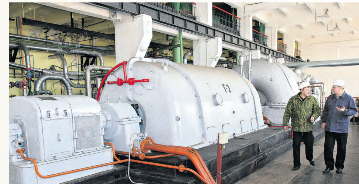
Первенец энергосистемы страны – Белорусская ГРЭС и сегодня в строю.

В самом Витебске новая электростанция появилась только после войны: первую очередь Витебской ТЭЦ сдали в эксплуатацию 27 декабря 1954 года. В 1960-м запустили 2-й турбогенератор, а в 1961-м и 3-й, станция достигла проектной мощности 56,3 МВт. В 2006 и 2011 годах изношенные 2-й и 3-й турбоагрегаты заменили более мощными. Сегодня ТЭЦ вырабатывает 245–285 млн. кВт/ч электроэнергии в год, годовой отпуск тепла равен 615–705 тыс. Гкал.