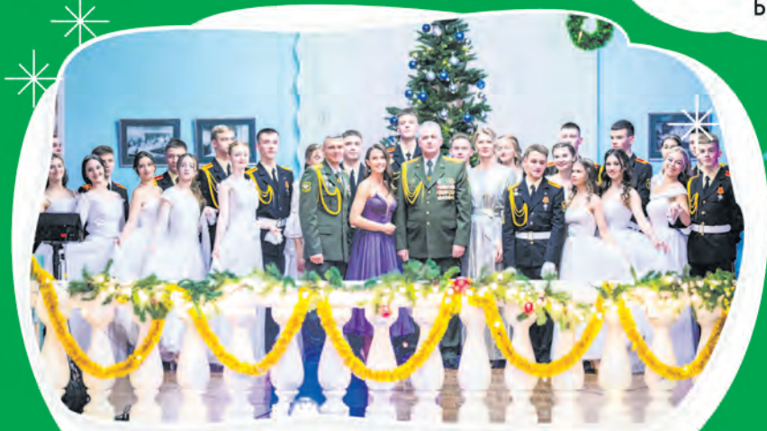
ППО УО «Минское суворовское военное училище»