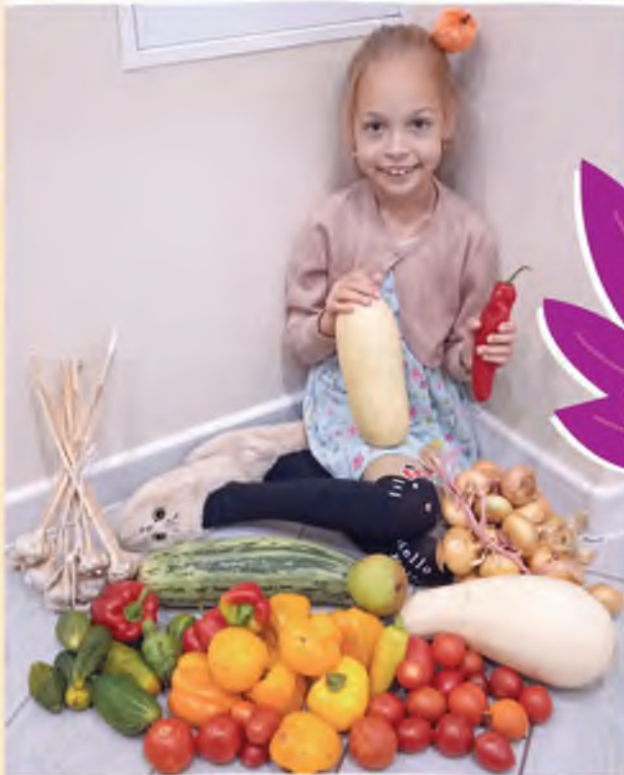
Автор фото: Владимир Зуев, Полоцк