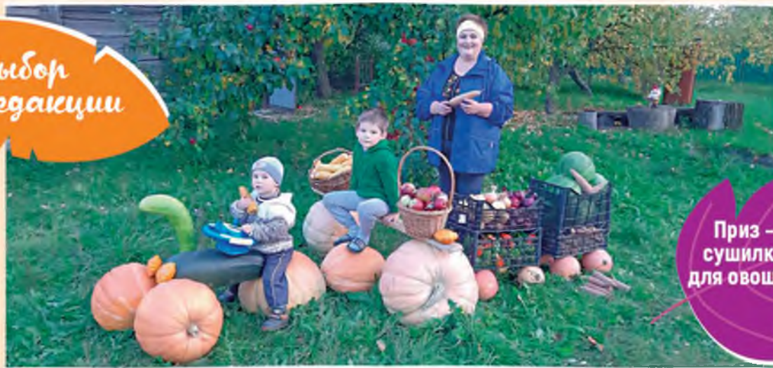
Могилевская обл.