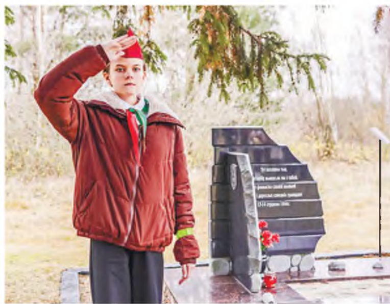
На посту Вахты памяти.

Вчера акцию «Мы вместе – ЗА Беларусь!» встречал Скидель, а сегодня она приехала в Мосты. Подробности читайте в следующем номере газеты и на портале 1prof.by