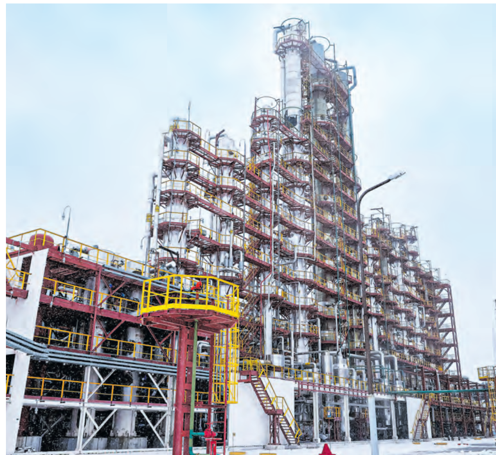
С момента начала выпуска продукции и по 1 февраля этого года «Полимир» произвел более 6 млн. тонн полиэтлена.

Здесь понимают, что одним из важных слагаемых развития любого предприя-