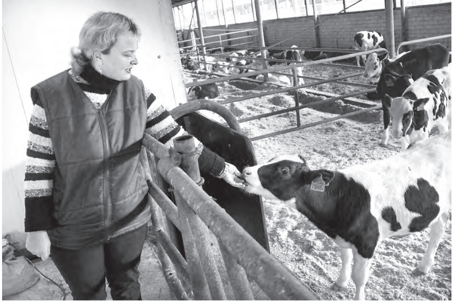
УСП «Новый Двор-Агро» специализируется на мясо-молочном направлении. В октябре начато строительство нового комплекса на 777 голов.

полностью реконструировали комнату приема пищи, в гардеробных установили сушильные шкафы для спецодежды. Также хозяйство модернизировало цеха по производству молока, что непосредственно влияет на улучшение условий труда работников.