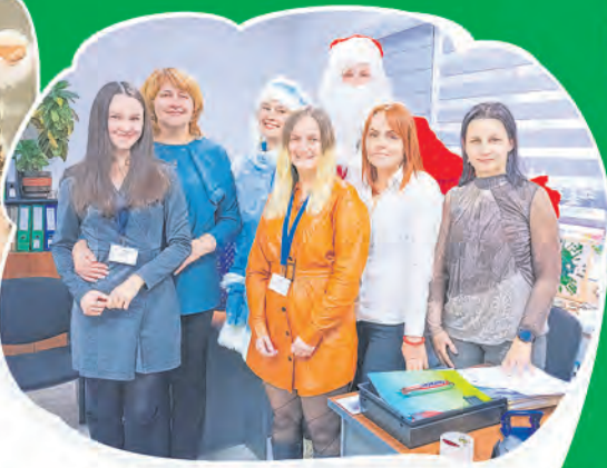
ППО филиала Белгосстраха по Гомельской области