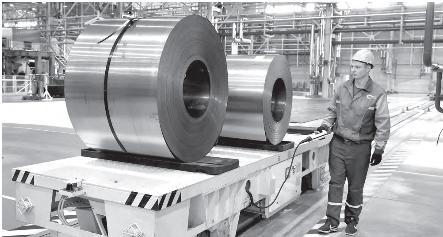
Недавно Миорский металлпрокатный завод стал государственным. На первом же собрании здесь решили создать профсоюзную первичку.

За 10 месяцев 2022 г. внешнеторговый оборот товаров в Беларуси составил 61 327,3 млн. долларов США , в т. ч. экспорт – 30 882,8 млн.