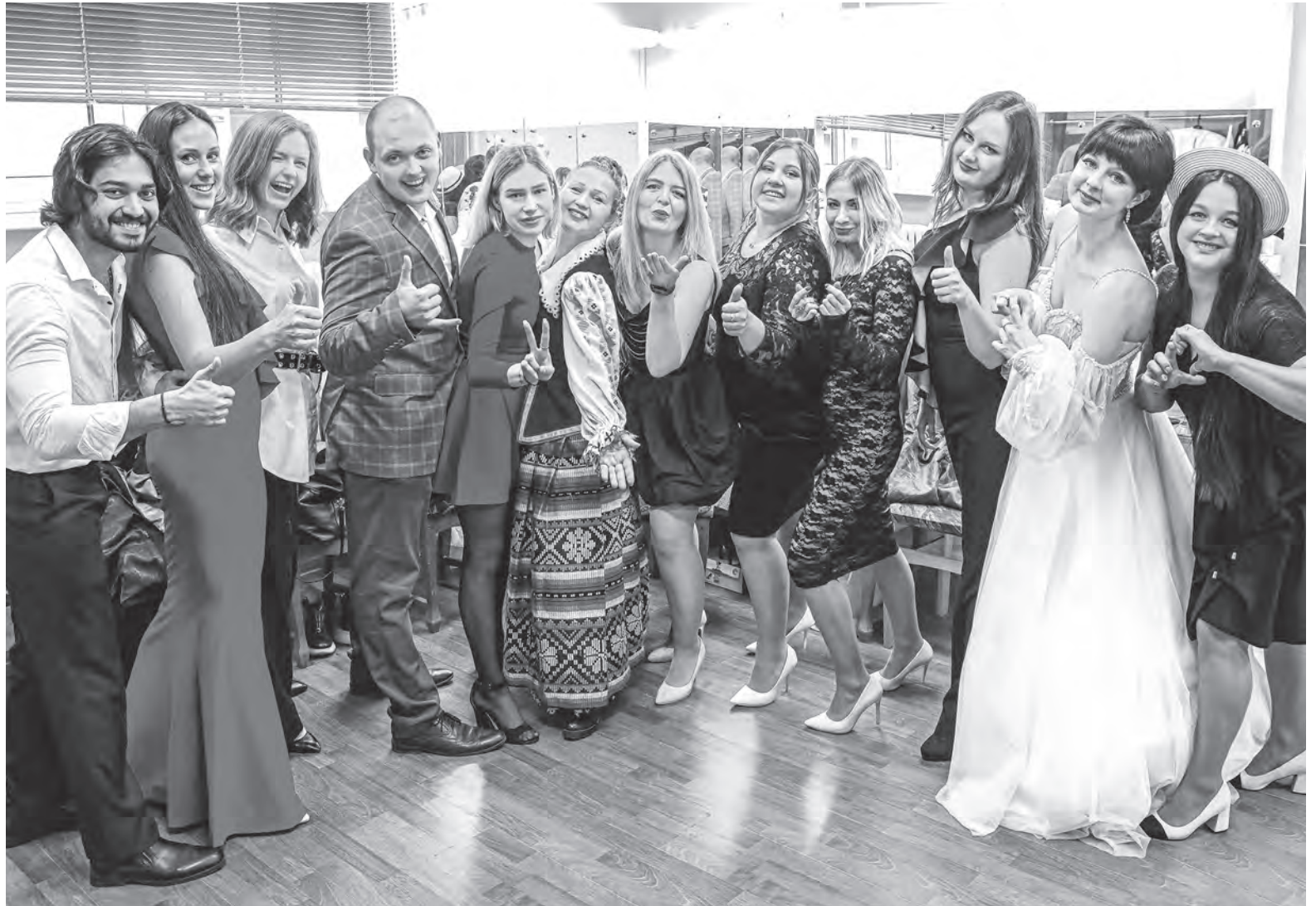
Команда профсоюза работников здравоохранения к кастингу готова!