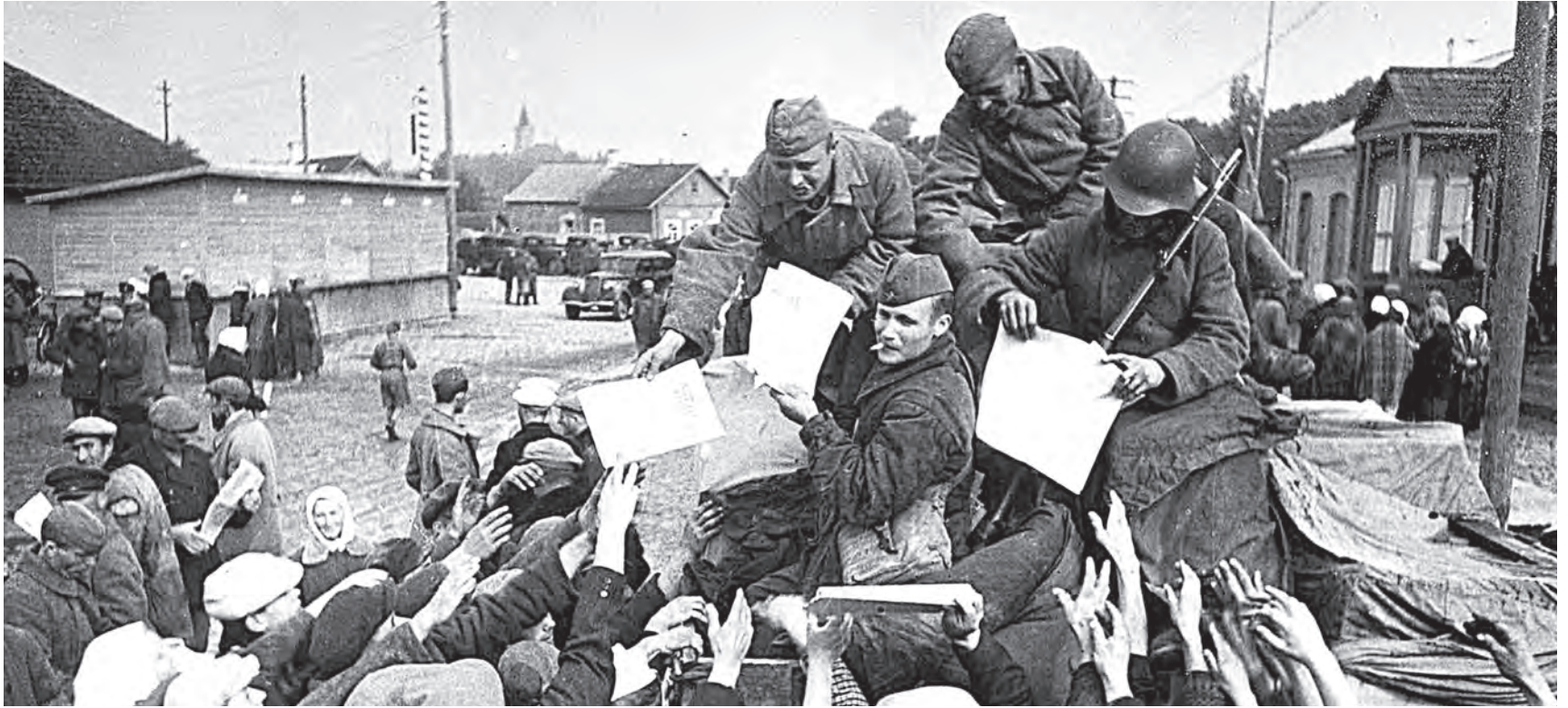
Бойцы Красной Армии раздают жителям освобожденного Молодечно советские газеты «Правда» и другие. Сентябрь, 1939 год.

День народного единства – самый молодой государственный праздник Беларуси. Утвержден чуть больше года назад, но дата, к которой он приурочен, зафиксирована в названиях улиц уже давно. Правда, некоторые видят в новом красном дне календаря иной, своевременный смысл. И они тоже правы. В 17 сентября сплелись наша история и современность.