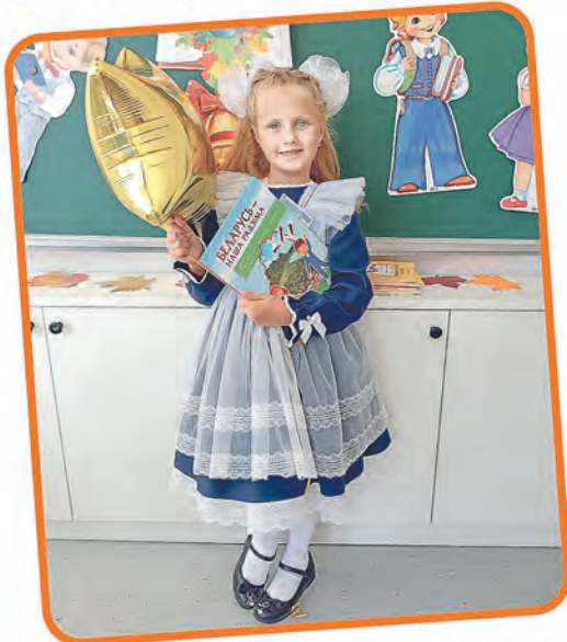
Автор фото: Ольга Веринская, Минская обл.