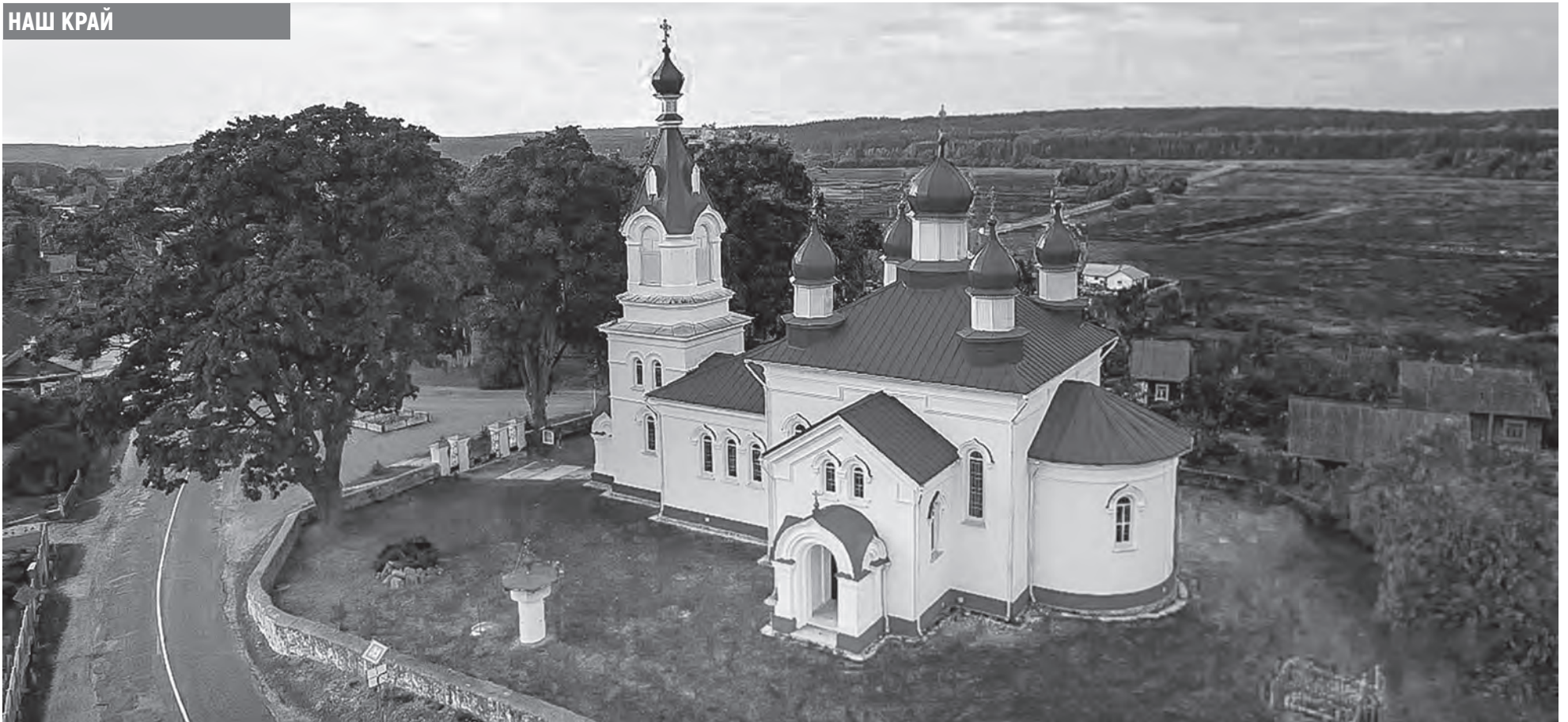
Храм святых апостолов Петра и Павла не закрывался ни разу с 1874 года.

Деревня Молчадь Барановичского района празднует 600-летие. Ей есть что вспомнить, чему порадоваться и о чем взгрустнуть. Зачем сюда приезжают из Чили и Аргентины, почему молчадцы собирали средства для строительства народного училища и увенчались ли успехом поиски сокровищ в местных курганах?