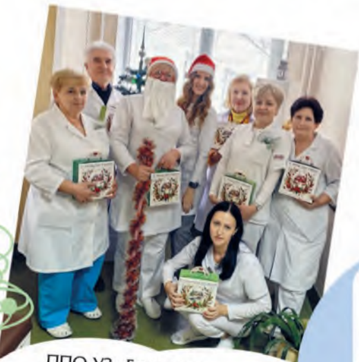
ППО УЗ «Брестская центральная поликлиника»