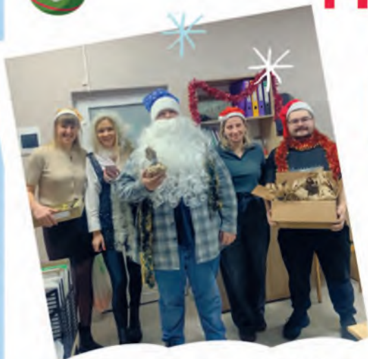
ППО РУП «Белгипролес»