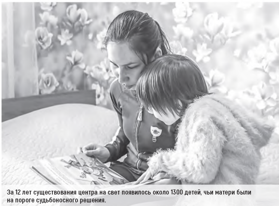
За 12 лет существования центра на свет появилось около 1300 детей, чьи матери были на пороге судьбоносного решения.