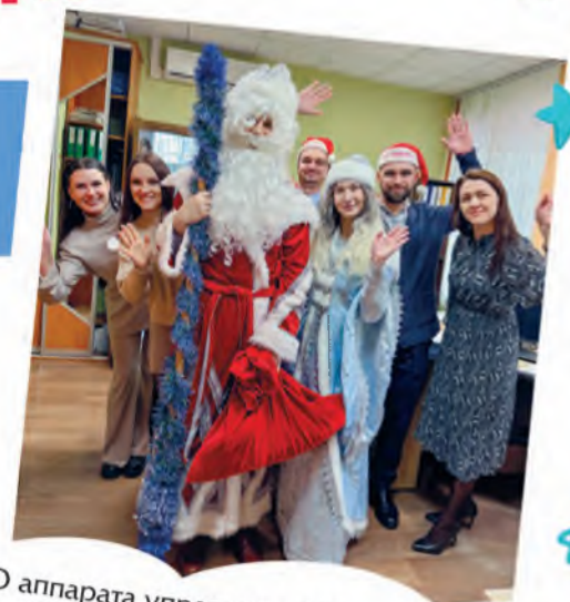
ППО аппарата управления УП «Гроднооблгаз»