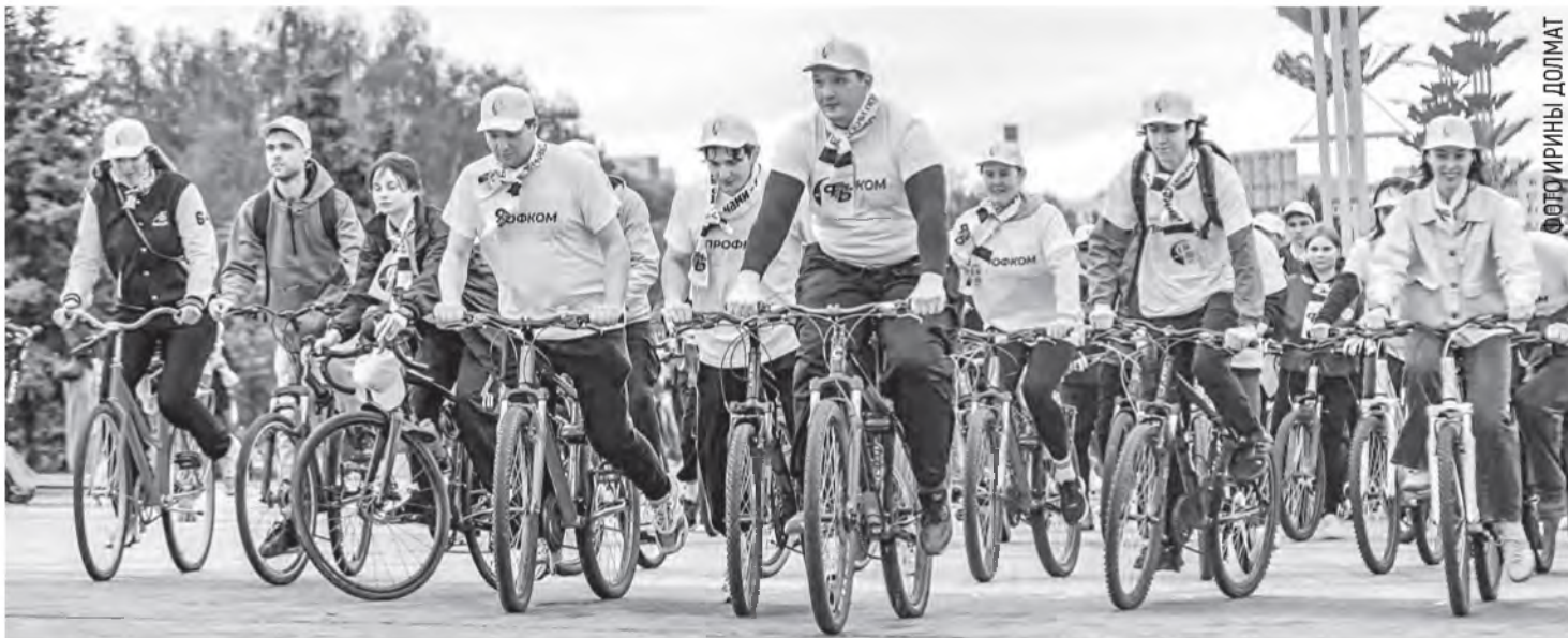
К велопробегу «Дорогами памяти» присоединяются тысячи профактивистов. Сегодня он проходит в формате марафона, в котором участвуют все регионы страны.