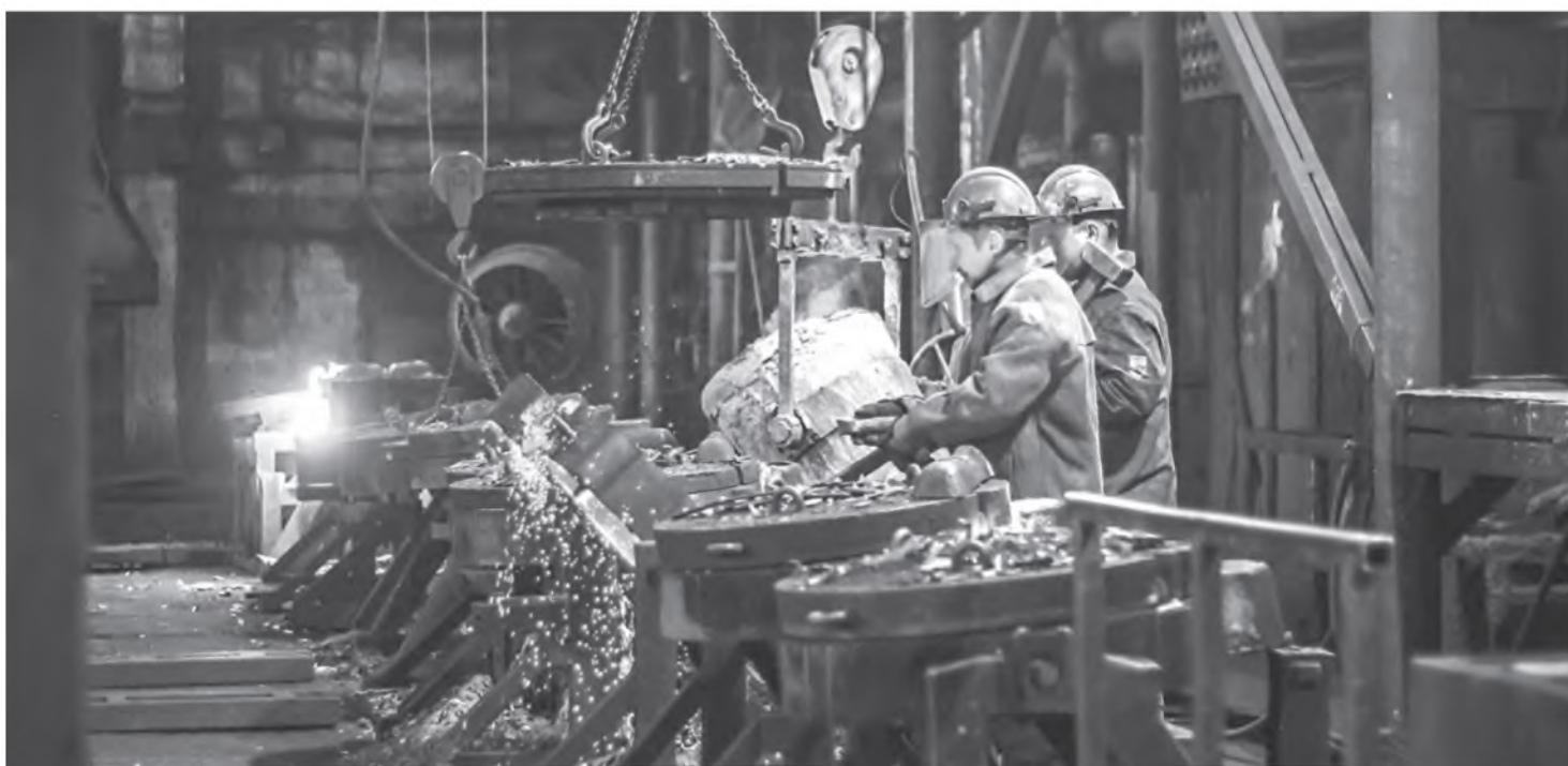
На Могилевском металлургическом заводе работают 20 общественных инспекторов по охране труда, которые ведут журналы ежедневного контроля.

Зима в разгаре, и морозы все крепчают. Как соблюдается температурный режим на рабочих местах? Профсоюзные инспекторы и журналисты нашей газеты побывали на Могилевском металлургическом заводе и Гомельской обувной фабрике «Труд».