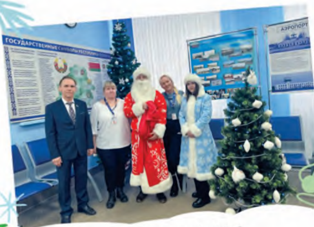
ППО Витебского филиала ГП «Белэаронавигация»