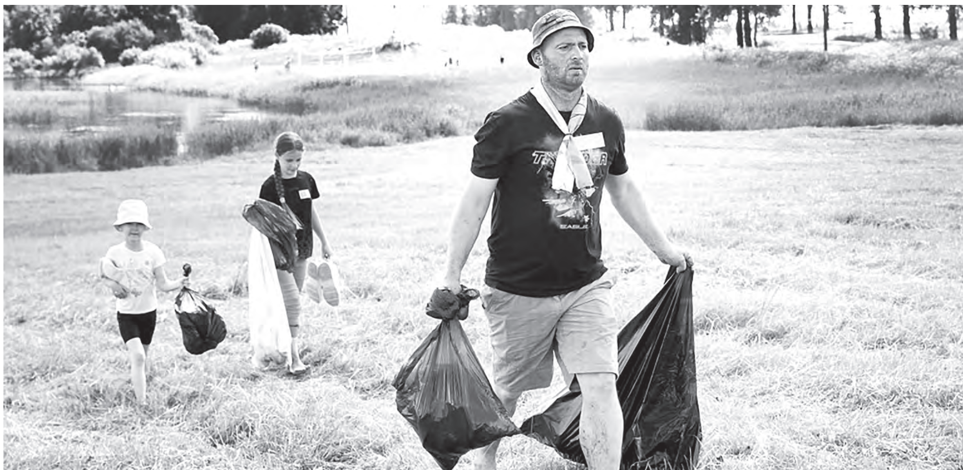
Первые «Чистые игры» прошли в минувшем году на берегу Шумилинского озера.

Виктория ДАШКЕВИЧ Фото автора и из архива Ирины КУЛИКОВОЙ