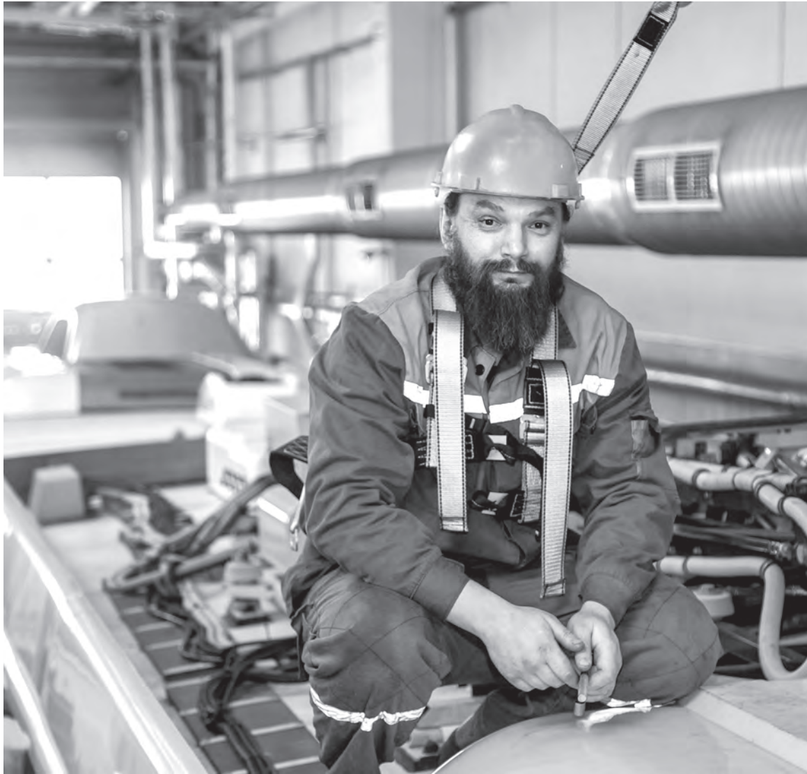
Фото носит иллюстративный характер.

непосредственному руководителю или любому должностному лицу о несчастном случае на производстве, а также о ситуациях, которые создают угрозу жизни и здоровью для него и окружающих. Также работник имеет право вносить предложения по улучшению условий и охраны труда; осуществлять самоконтроль за соблюдением требований охраны труда и взаимоконтроль за соблюдением этих требований на смежных рабочих местах.