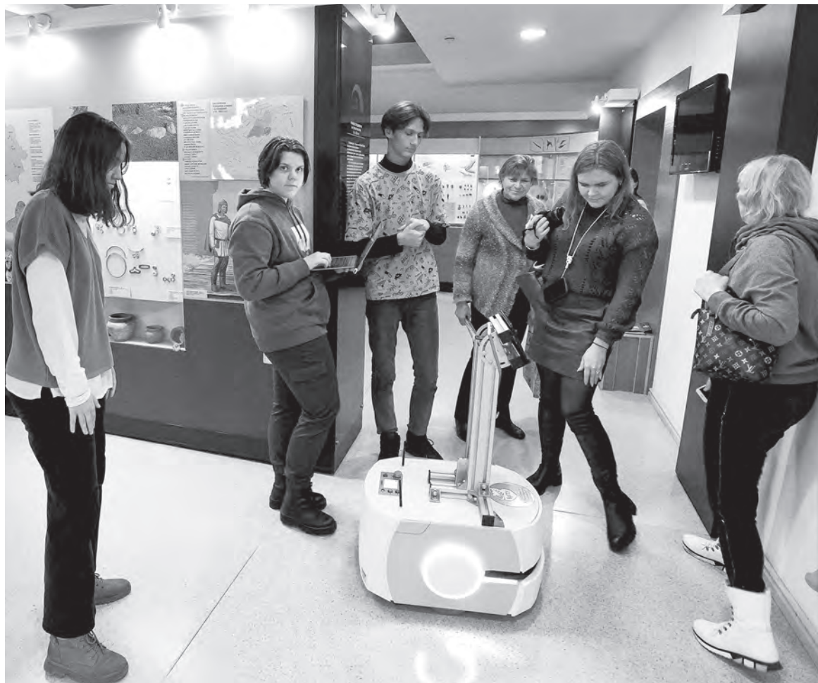
Робот Мироша, «работающий» экскурсоводом в Брестском областном краеведческом музее, «родился» в стенах лаборатории БрГТУ.

– У нас два основных направления работы. Студенческие проекты, рассчитанные на популяризацию робототехники, к ним как раз и относится Мироша. Однако превалирует сейчас иная ветвь деятельности: выполнение конкретных проектов заказчиков для внедрения