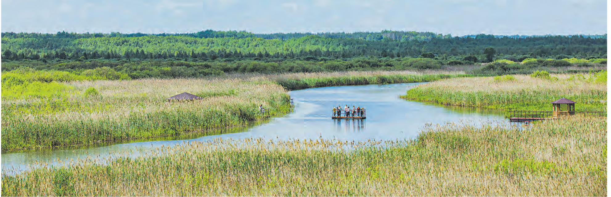
Экологическая тропа в биологическом заказнике «Споровский».