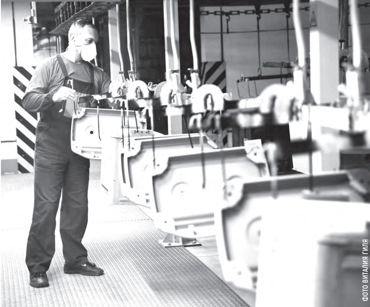
Фото носит иллюстративный характер.

Как связаны производственный травматизм и средства индивидуальной защиты? Вопрос кажется риторическим, однако практика показывает, что некоторые работники и наниматели забывают ответ на него.