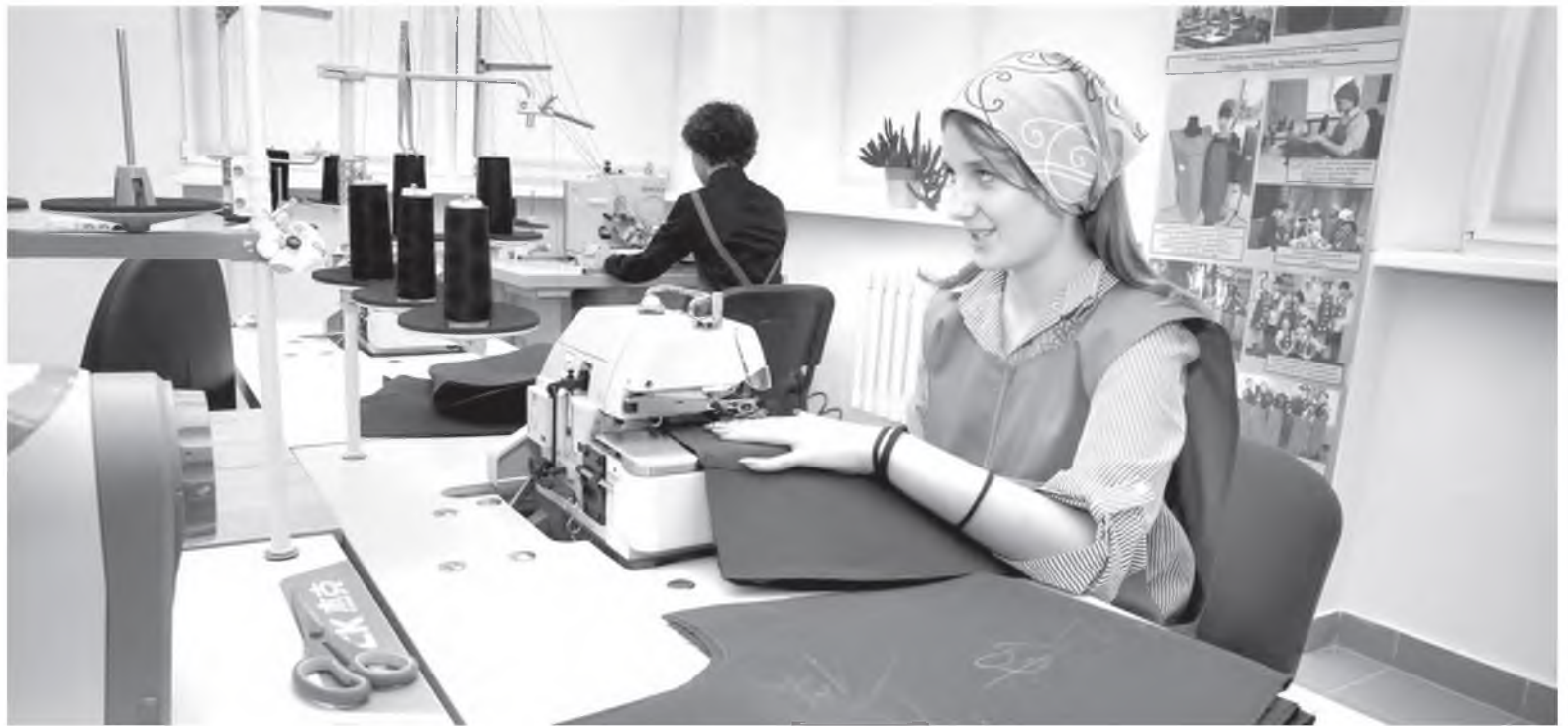
С 2019 года на базе Барановичского колледжа технологии и дизайна работает центр компетенций современных технологий в швейном производстве, где ежегодно более 800 учащихся области совершенствуют свои профессиональные навыки.

В Брестской области 46 колледжей, в которых рабочим специальностям обучают свыше 4 тыс. человек и еще 1800 дают среднее специальное образование. Спрос на рынке труда диктуют предприятия, а им остро необходимы операторы станков с ЧПУ,