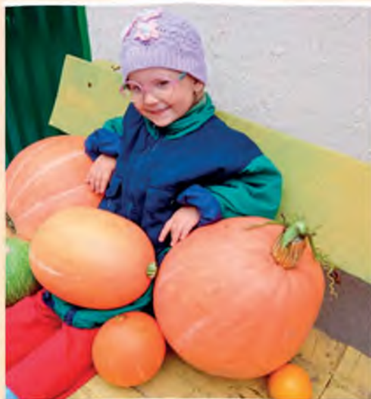
Автор фото: Вероника Нехороших, Орша