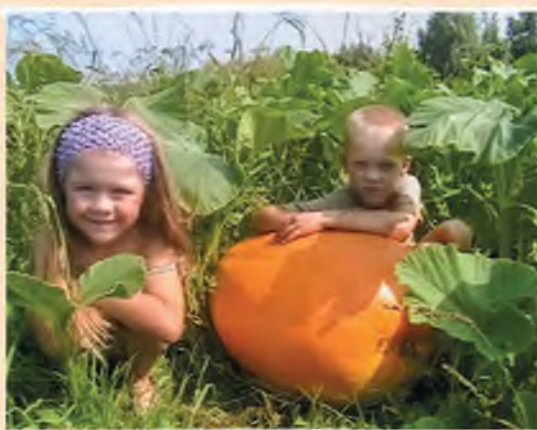
Автор фото: Александра Ананченко, Витебская обл.