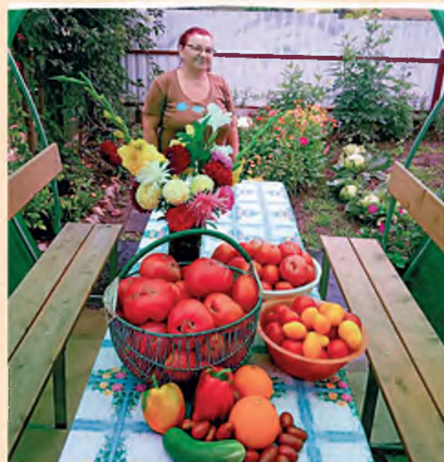
Автор фото: Татьяна Графутко, Орша