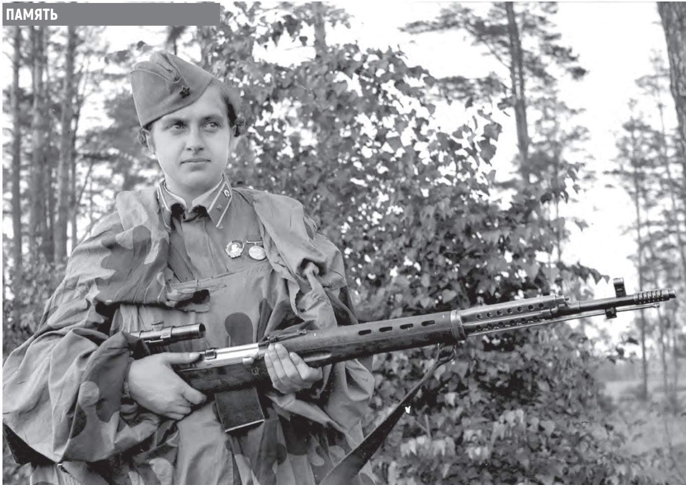
Людмила Павличенко – самая успешная женщина-снайпер в мировой истории, Герой Советского Союза.