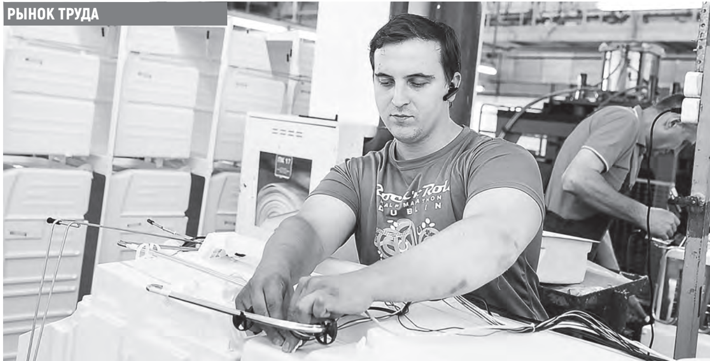
Фото носит иллюстративный характер.