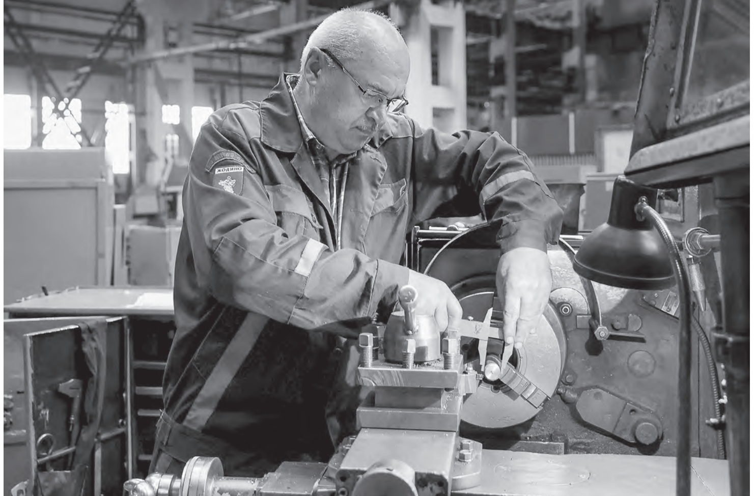
Фото носит иллюстративный характер.

– Однако сверхурочные работы провоцируют рост травматизма, профес-