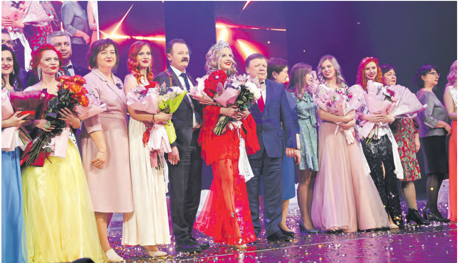
В Гродно впервые состоялся межотраслевой конкурс женского творчества «Проф-Леди».