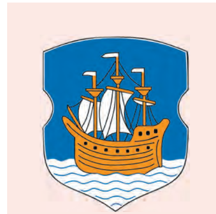
Герб города Полоцка представляет собой «барочный», или «германский», щит, в синем поле которого изображен трехмачтовый корабль с серебряными парусами, плывущий по серебряным волнам.

В нем представлена история города от древнейших времен до начала Великой Отечественной войны. Самым древним экспонатам около 15 тыс. (!) лет.