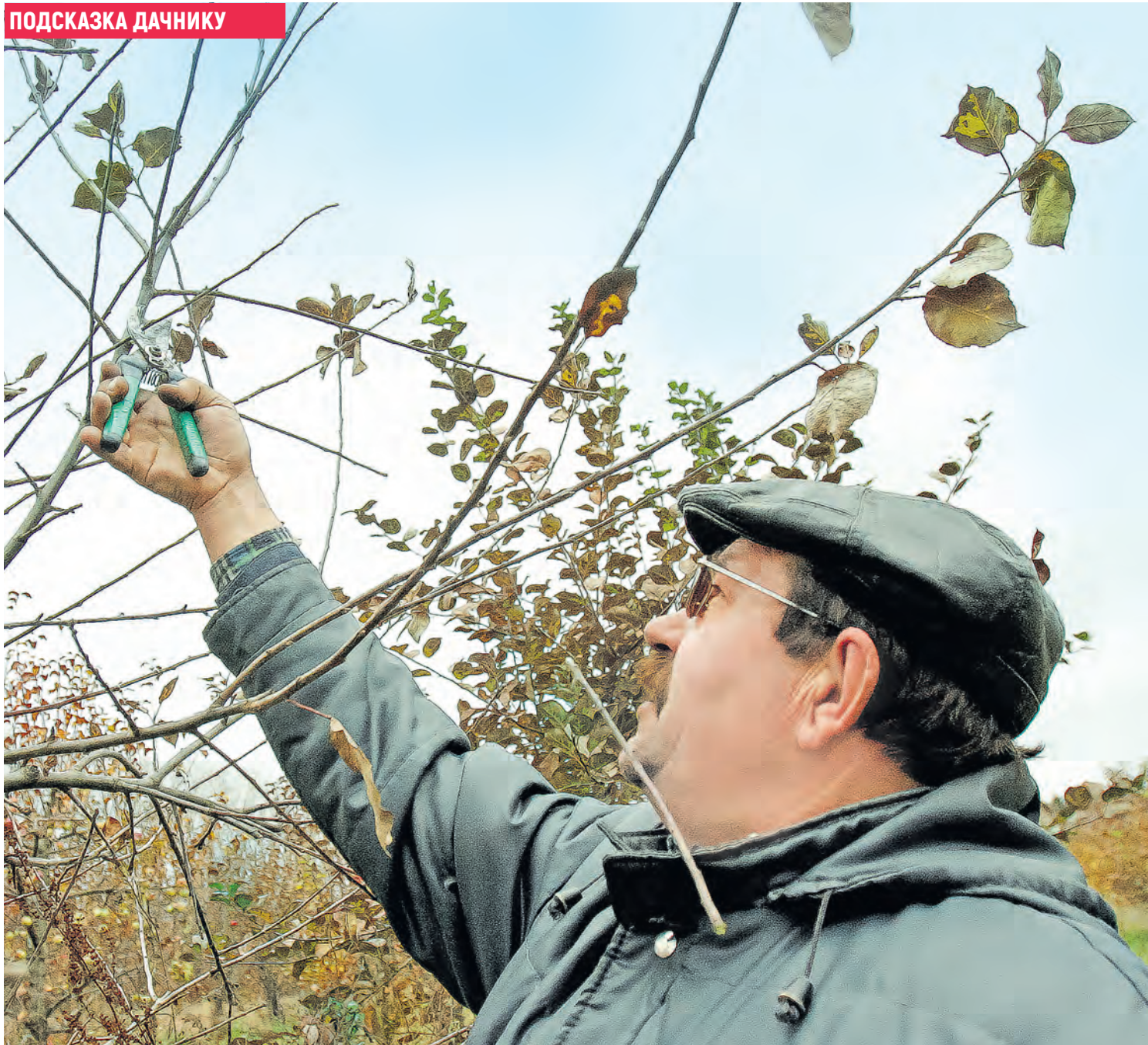
Фото носит иллюстративный характер.