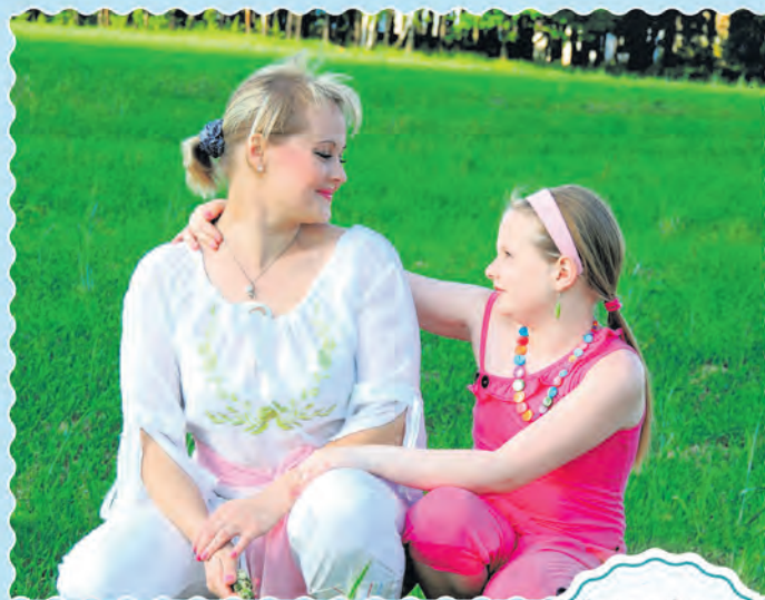
Автор фото: Елена Сенченко, Жодино