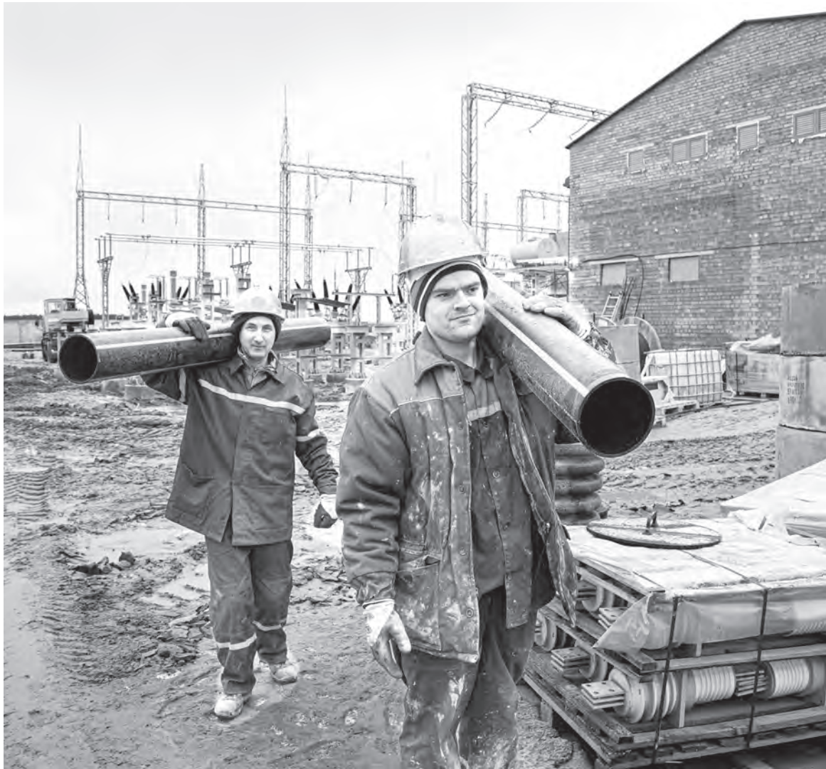
Продолжительность рабочего времени для работающих по совместительству не может превышать половины нормальной продолжительности рабочего времени.