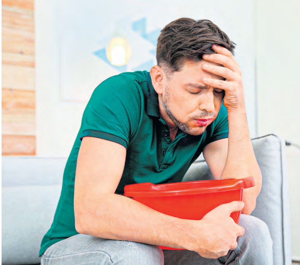
После появления первых признаков ротавирусной инфекции – боли в животе, тошноты, рвоты – у больного развивается диарея.

Признаками критического обезвоживания при ротавирусной инфекции становятся спутанность или потеря сознания, а также судороги.