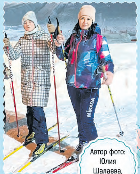
Автор фото: Юлия Шалаева, Могилев

Подробности конкурса на сайте belchas.1prof.by