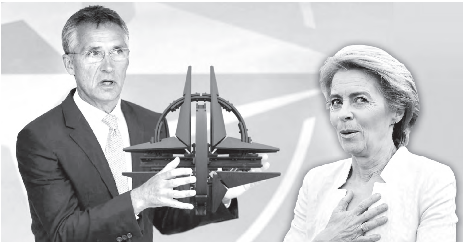
Генсек НАТО Йенс Столтенберг готов передать альянс преемнику. Готова ли к этой роли глава Еврокомиссии Урсула фон дер Ляйен?