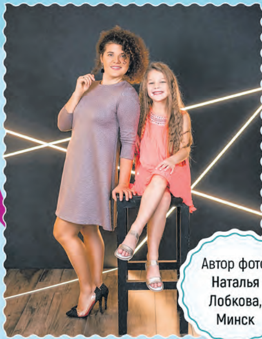
Автор фото: Наталья Лобкова, Минск