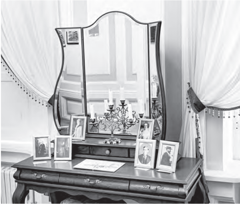
В музейной экспозиции можно увидеть портреты представителей знаменитого рода.

В феврале во дворце традиционно проходит бал.