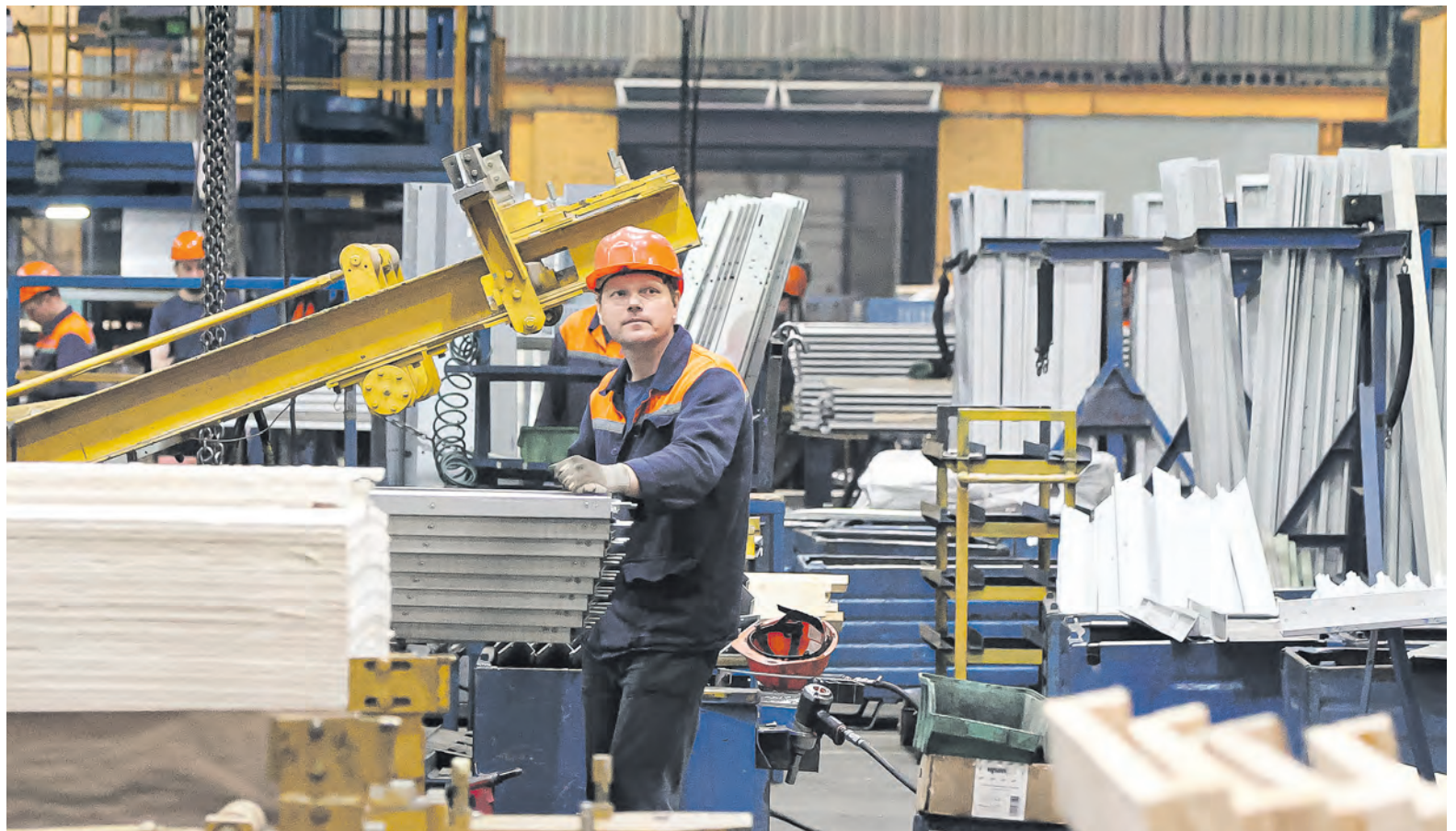
Усилить работу общественных инспекторов по охране труда помогают регулярные обучающие семинары, а также прописанные в колдоговорах меры для их материального и морального стимулирования.

Потенциал для роста первичных профсоюзных организаций в области есть. Проводим работу с нанимателями, местными исполнительными органами власти и трудовыми коллективами. За 2022 год в Могилевской области появилось 125 новых первичек. Сейчас ведем переговоры о создании профкомов с 322 организациями, 13 – уже подготовили документы на регистрацию. Новым первичкам помогаем составить и заключить колдоговоры. Они должны быть подписаны сторонами в течение полугода после создания профорганизации.