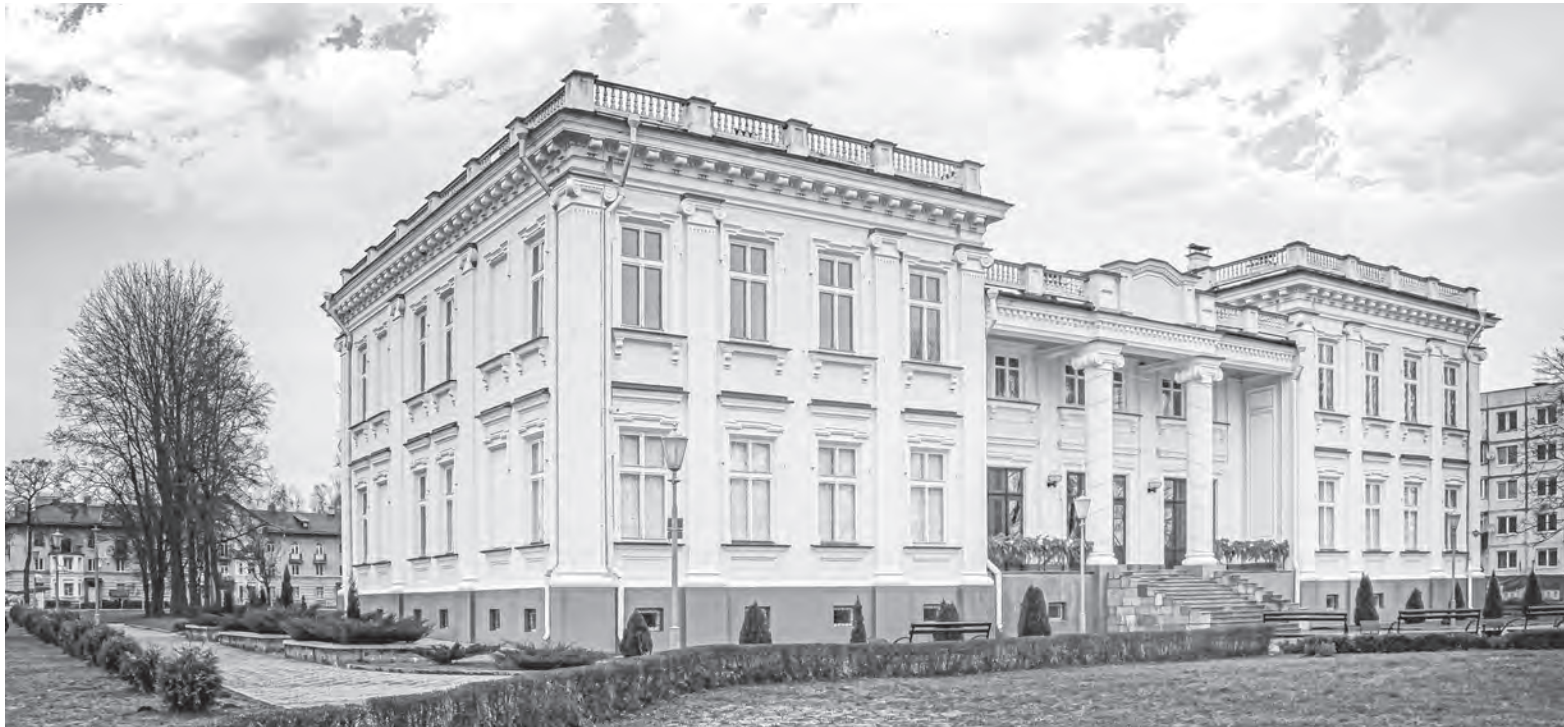
В 2015 году дворец Друцких-Любецких открылся после реставрации.

Бывший дворец Друцких-Любецких привлекает внимание каждого, кто оказывается в Щучине. Величественное здание, созданное в переходном от барокко к классицизму стиле, за схожесть в композиции называют младшим братом Малого Трианона во французском Версале.