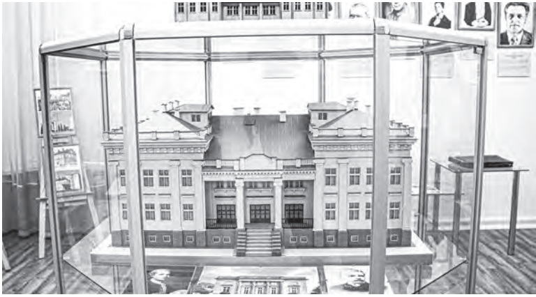
В ДТДиМ создали макет дворца конца XIX – начала XX века.