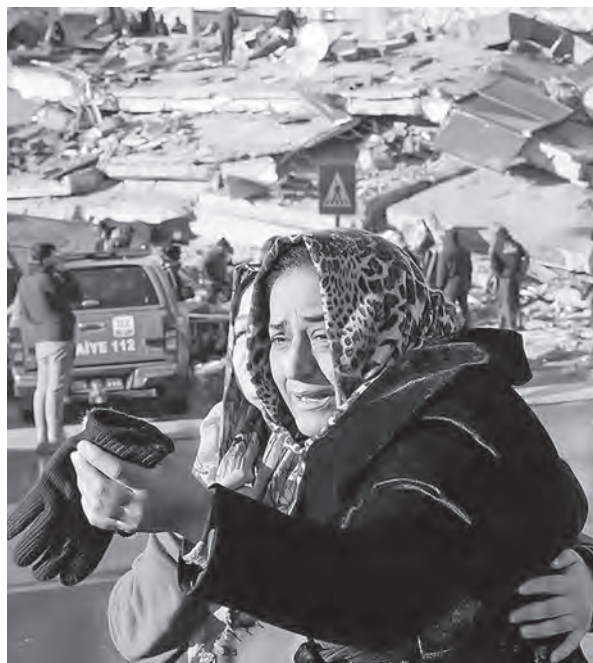
Никита ГРЕБЕННИКОВ, фото Степана ТЮШКЕВИЧА и из открытых интернет-источников

Напомним, в понедельник мощное землетрясение силой 7,7 балла потрясло обширные районы Турции и Сирии. В течение дня произошли новые толчки магнитудой до 7,5 балла. Число погибших на момент подготовки газеты к печати превысило 14000 человек. Цифры продолжают расти, под завалами все еще остаются люди.