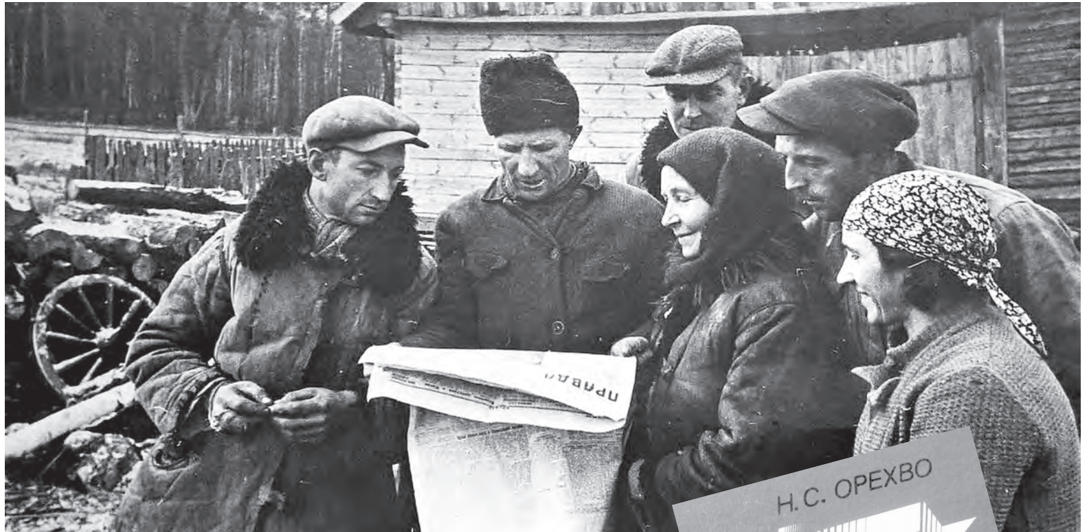
Жители Западной Белоруссии читают газету «Правда». 1939 год.