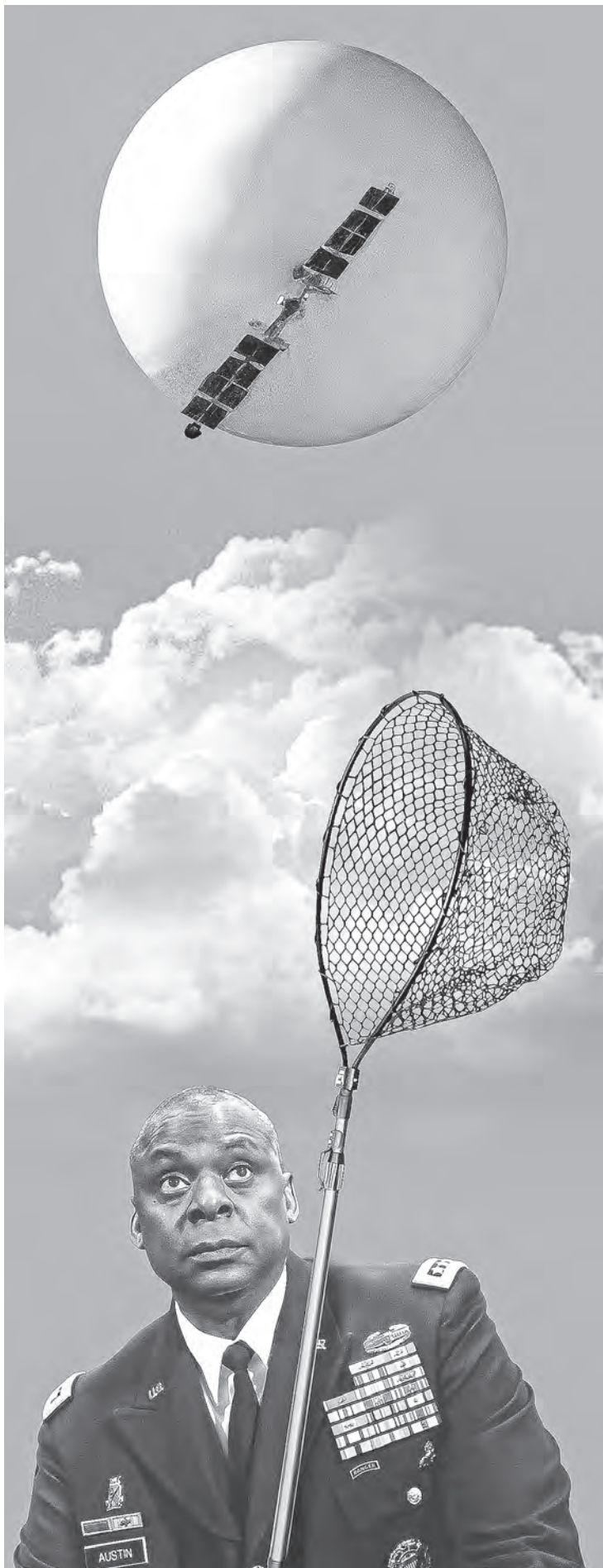
Глава Пентагона Ллойд Остин несколько дней караулил китайский аэростат.

Он и вправду думает, что помощь десяткам тысяч пострадавших от землетрясения сирийцев выглядела бы «довольно иронично»? Если так, то после работы в американском внешнеполитическом ведомстве Нед Прайс без труда устроится в редакцию «Шарли Эбдо».