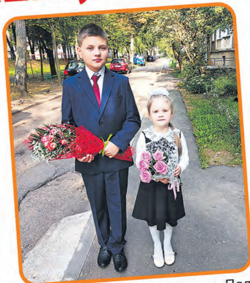
Автор фото: Анастасия Леоненко, Полоцк