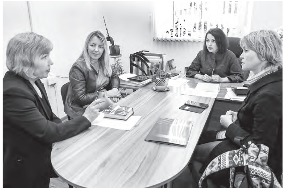
Любые вопросы, возникающие в трудовом коллективе, социальные партнеры решают совместно.