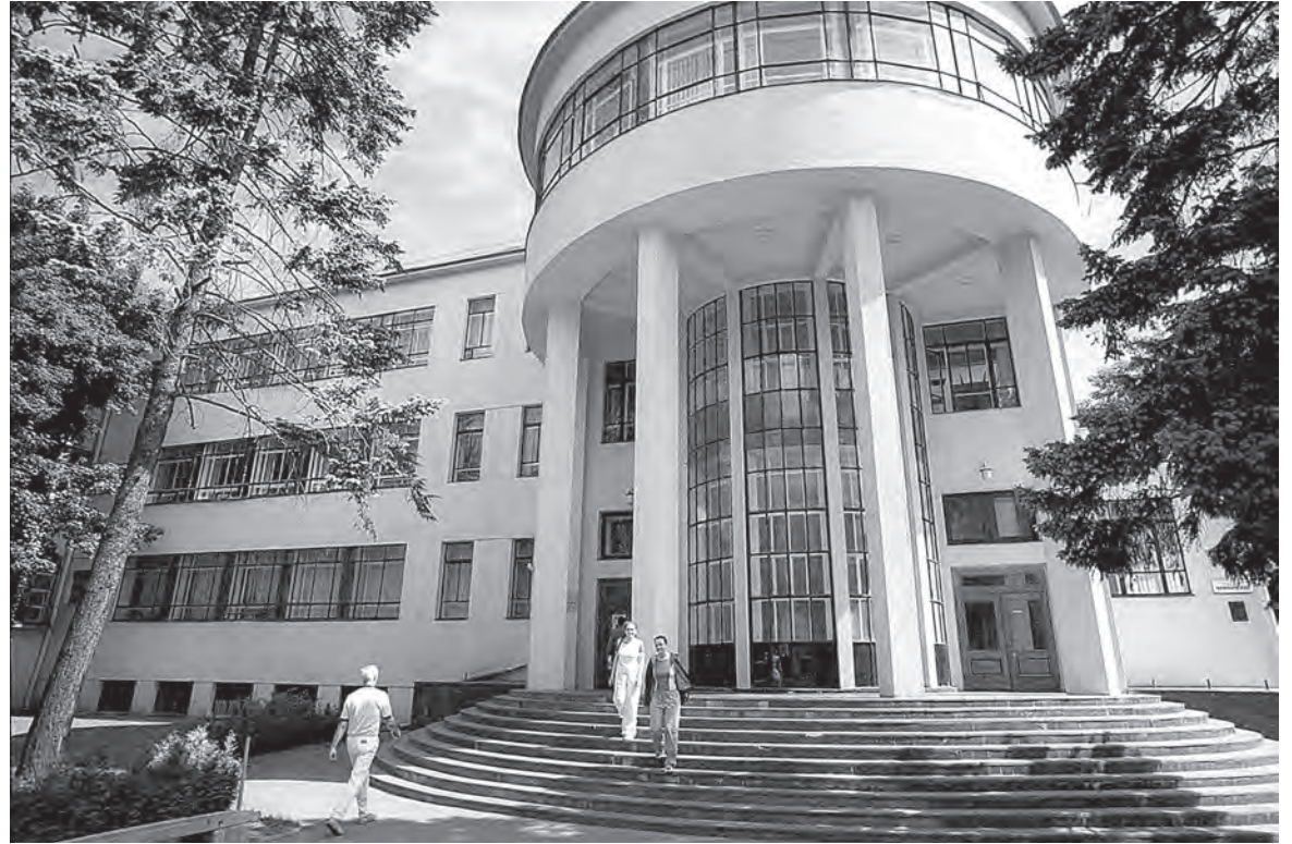
В этом здании до 2006 года располагалась Национальная библиотека Беларуси, ранее Государственная библиотека имени В.И. Ленина.

Во время Великой Отечественной войны преподавал в Московском библиотечном институте. В 1944 году по его инициативе в Минском государственном педагогическом институте им. А.М. Горького был создан библиотечный факультет. До 1957