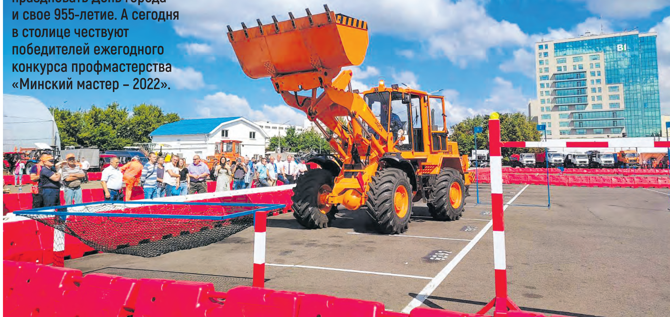
На базе ГПО «Горремавтодор Мингорисполкома» состоялся финал конкурса «Минский мастер – 2022» по профессиям асфальтобетонщик и водитель погрузчика.

Завтра Минск будет праздновать День города и свое 955-летие. А сегодня в столице чествуют победителей ежегодного конкурса профмастерства «Минский мастер – 2022».