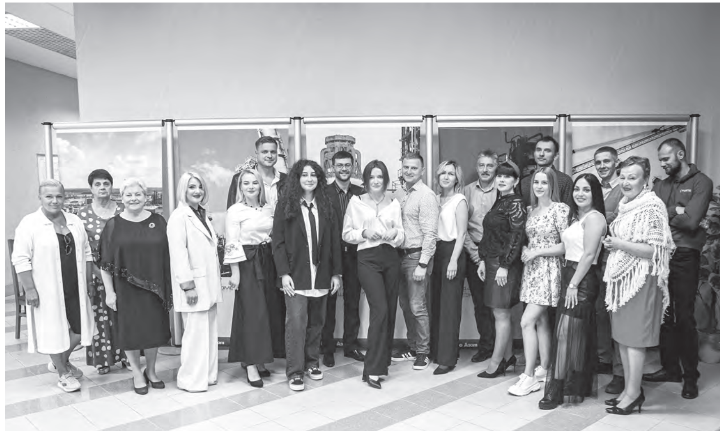
Во время кастинга в ОАО «Гродно Азот».

В главном корпусе ОАО «Гродно Азот» под прицелы телекамер попали во-