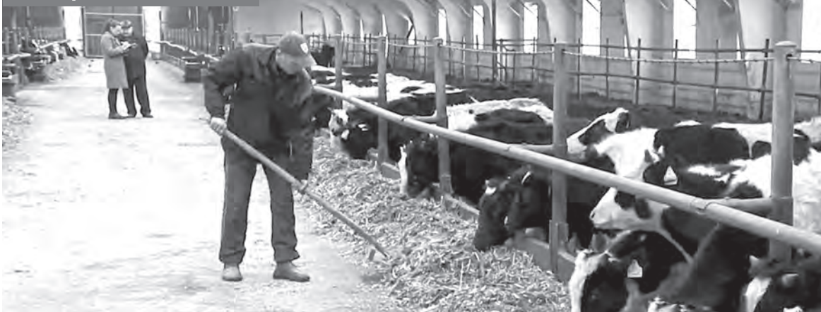
ОАО «Агрокомбинат «Восход» занимается животноводством и выращиванием зерна.