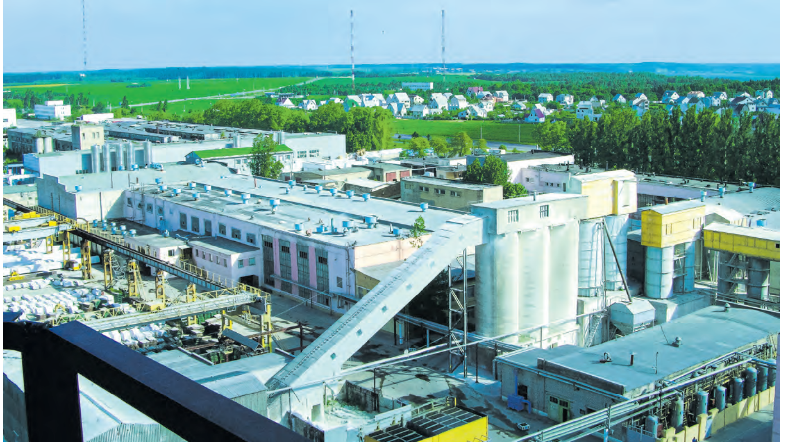
При желании построить дом на «Могилевском КСИ» можно приобрести 90% стройматериалов.

– Подобные удобства и ежегодные дополнения в наш колдоговор способствуют тому, что