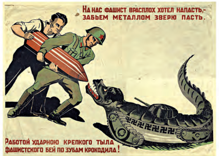
РАБОТОЙ УДАРНОЮ КРЕПКОГО ТЫЛА ФАШИСТСКОГО БЕЙ ПО ЗУБАМ КРОКОДИЛА!