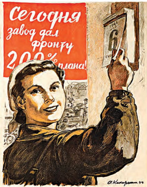
ОТМЕТИМ КАЖДЫЙ ДЕНЬ НОВОЙ ПОБЕДОЙ ТРУДА!