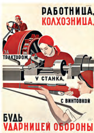
БУДЬ УДАРНИЦЕЙ ОБОРОНЫ