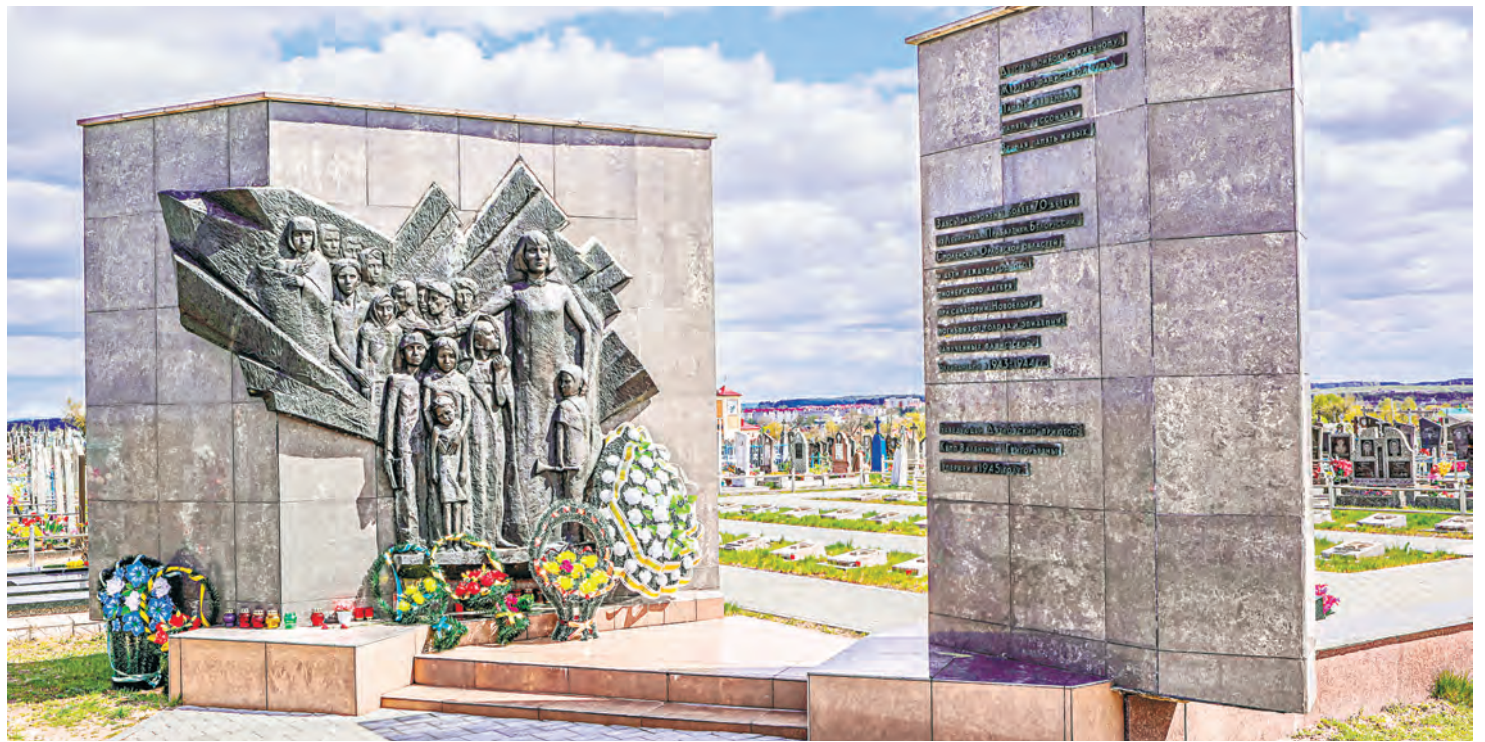
Мемориал «Дети лихолетья», посвященный погибшим воспитанникам Дятловского приюта.