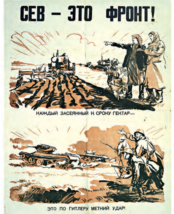
СЕВ - ЭТО ФРОНТ!