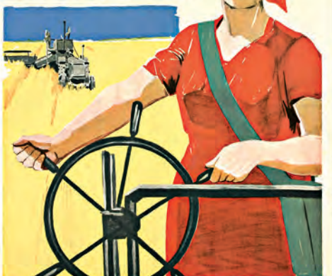
УБРАТЬ УРОЖАЙ ПОЛНОСТЬЮ!