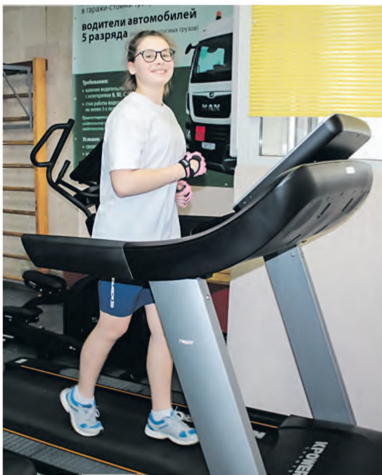
В Гомельском областном центре олимпийского резерва по паралимпийским и дефлимпийским видам спорта оттачивают мастерство и дети, и взрослые.