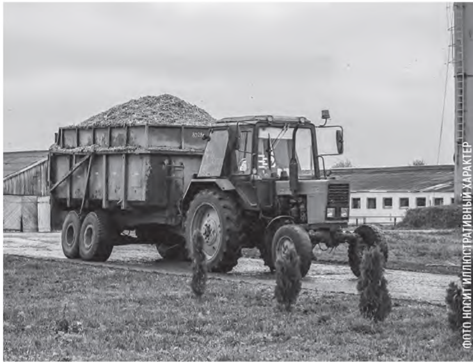
ФОТО: НАСИТ ИЛЛЮСТРАТИВНЫЙ ХАРАКТЕР

Закон требует от работников качественно выполнять трудовые обязанности и бережно относиться к имуществу нанимателя. Однако иногда на работе люди вольно или невольно становятся причиной поломки оборудования, порчи продукции или причинения другого вреда. Кто в таком случае должен возмещать ущерб предприятию? В каком порядке его могут взыскать?