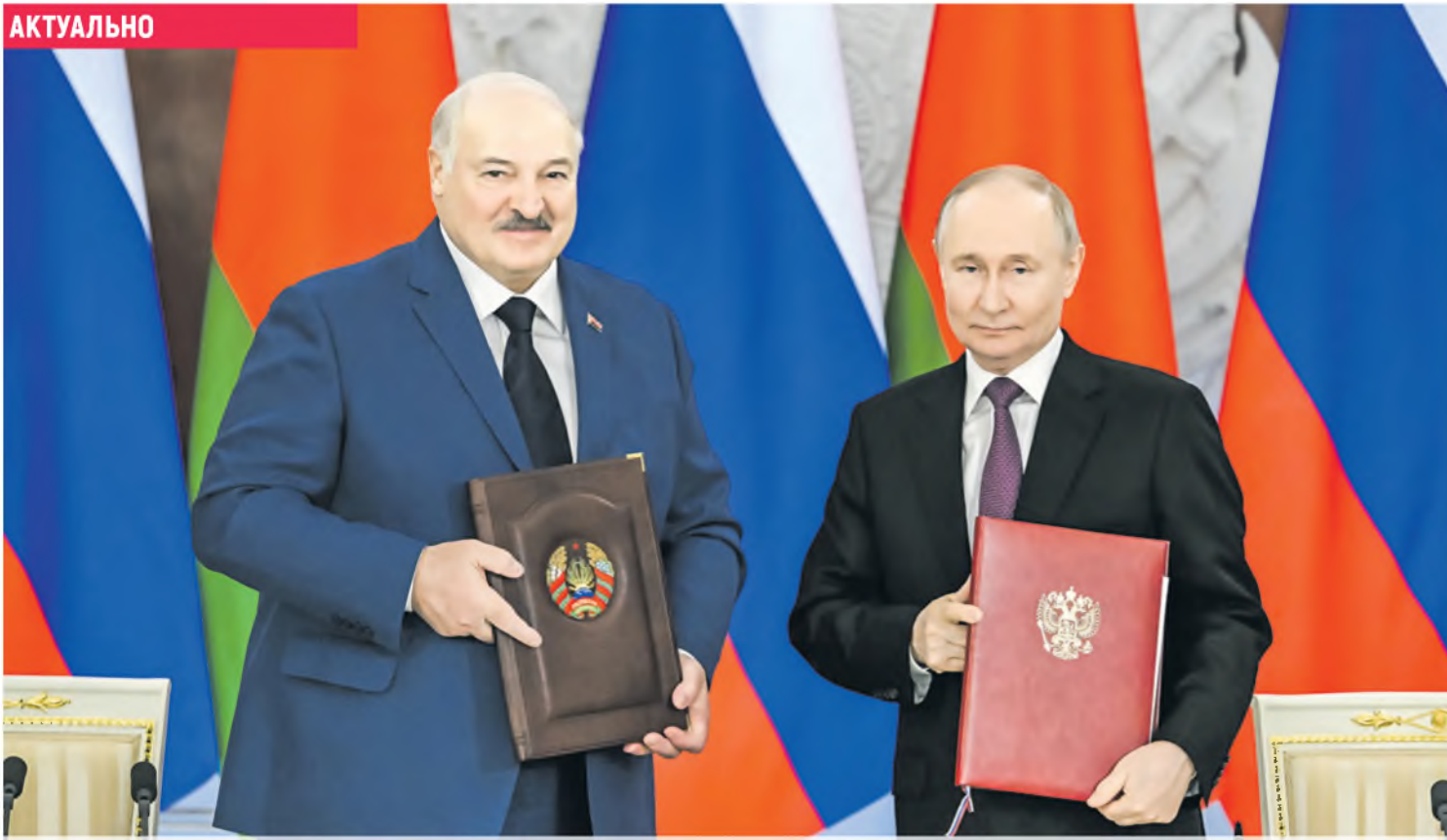
Президенты Беларуси и России Александр Лукашенко и Владимир Путин по итогам переговоров в Москве подписали совместное заявление. Март 2025 г.