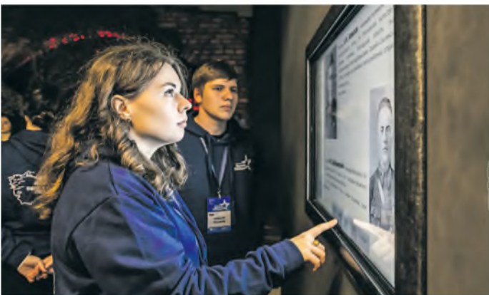
Участники форума посетили Музей истории Великой Отечественной войны в Минске. Больше фотографий вы можете посмотреть на портале 1prof.by