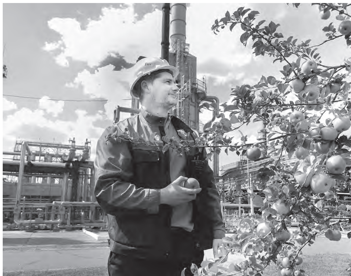
Яблоневый сад на территории газоперерабатывающего завода посажен по инициативе работников.

Коллективный договор «Белоруснефти» распространяется на 23907 человек и является одним из самых насыщенных в стране.