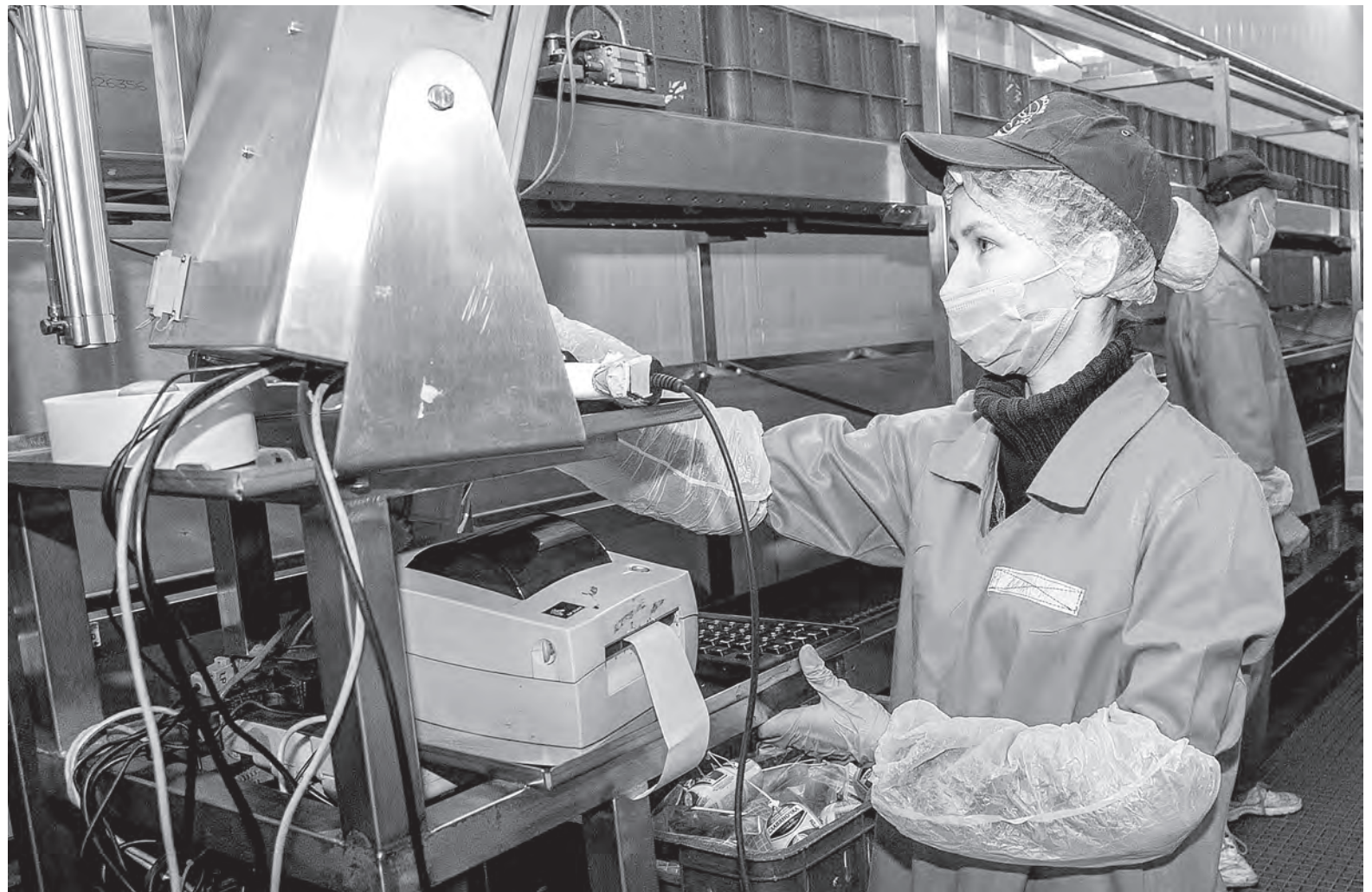
Фото носит иллюстративный характер.

– Отзыв из трудового отпуска регулируется частями 2 и 3 статьи 174 ТК. Согласно данной норме трудовой отпуск может быть прерван по предложению нанимателя и с согласия работника. Коллективным договором могут определяться обстоятельства, при наличии которых допускается отзыв из отпуска.