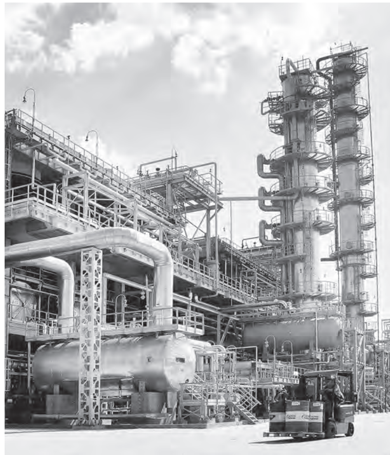
Белорусский газоперерабатывающий завод полностью закрывает потребности страны в сжиженном газе и стабильном газовом бензине.