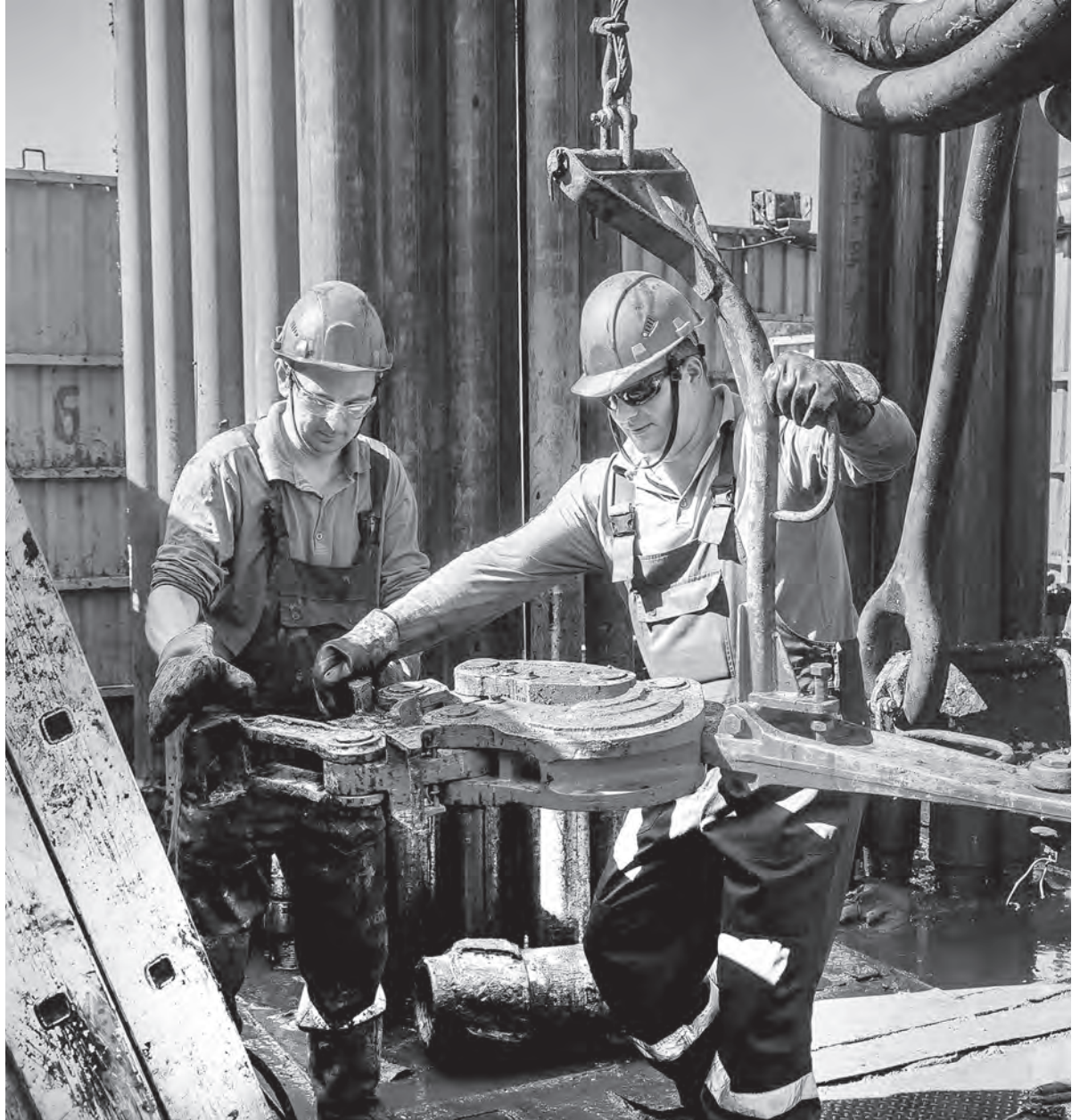
Бурение нефтяной скважины № 226 доверили передовой бригаде «Белоруснефти», которая в прошлом году установила абсолютный рекорд в объединении – пробурила 19600 метров.

4 сентября профессиональный праздник отметят все, кто связал судьбу с нефтяной, газовой и топливной промышленностью. От их нелегкого слаженного труда зависит и бесперебойная деятельность всех отраслей народного хозяйства, и комфортная жизнь каждого из нас. Корреспонденты «Беларускага Часу» отправились на объекты производственного объединения «Белоруснефть» в Речицкий район и запечатлели несколько фрагментов из трудовых будней нефтяников и газовиков.