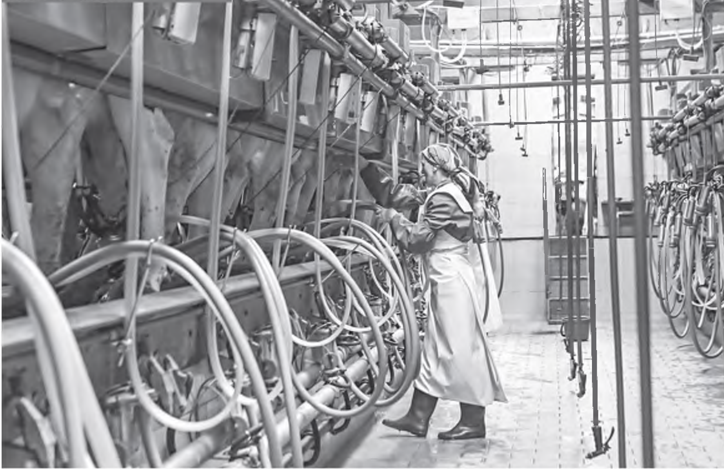
Фото носит иллюстративный характер.