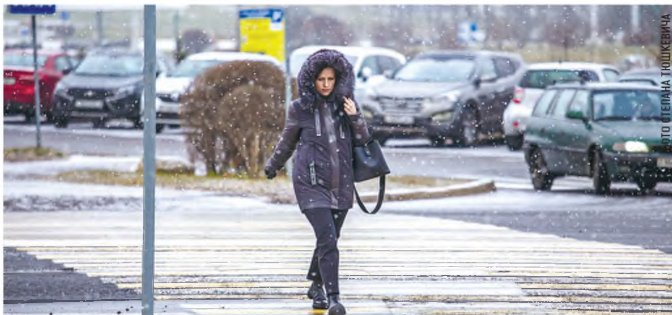
Фото носит иллюстративный характер.

На днях поздно возвращалась с тренировки. На улице почти никого не было, и даже вечно шумный столичный проспект совсем затих. От дома меня отделял лишь пешеходный переход со светофором. Загорелся красный – я остановилась. Рядом со мной так же замерла женщина. Мы посмотрели друг на друга, по сторонам, убедились, что никому до нас нет дела, и... продолжили ждать зеленый. Если бы засняли нас в этот момент и выложили видео в интернет, наверняка кто-то прокомментировал бы: «Тест на белоруса пройден».