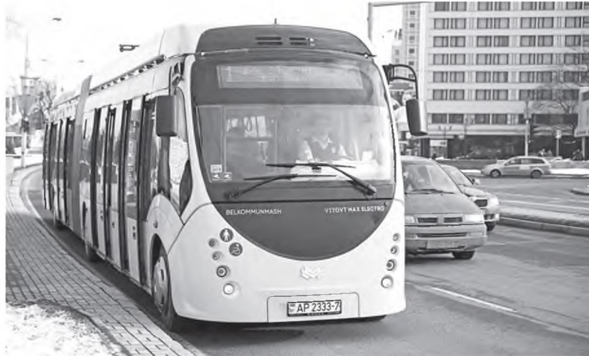
Белорусский электробус – тоже часть «зеленой» энергетики.

Это результат планомерной и продуманной политики, комплекса мер и новых подходов. Все эти годы в нашей стране масштабно занимались строительством газоочистного оборудования, развитием электротранспорта, переходом на экологически чистые виды топлива и сырья (в частности, отказ от озоноразрушающих веществ). Значительный вклад внесет БелАЭС.