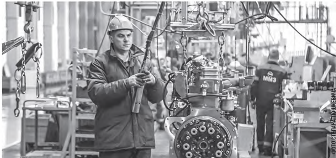
За 6 месяцев профсоюзные юристы выявили почти 9 тыс. нарушений законодательства о труде, проверив 2,2 тыс. организаций.