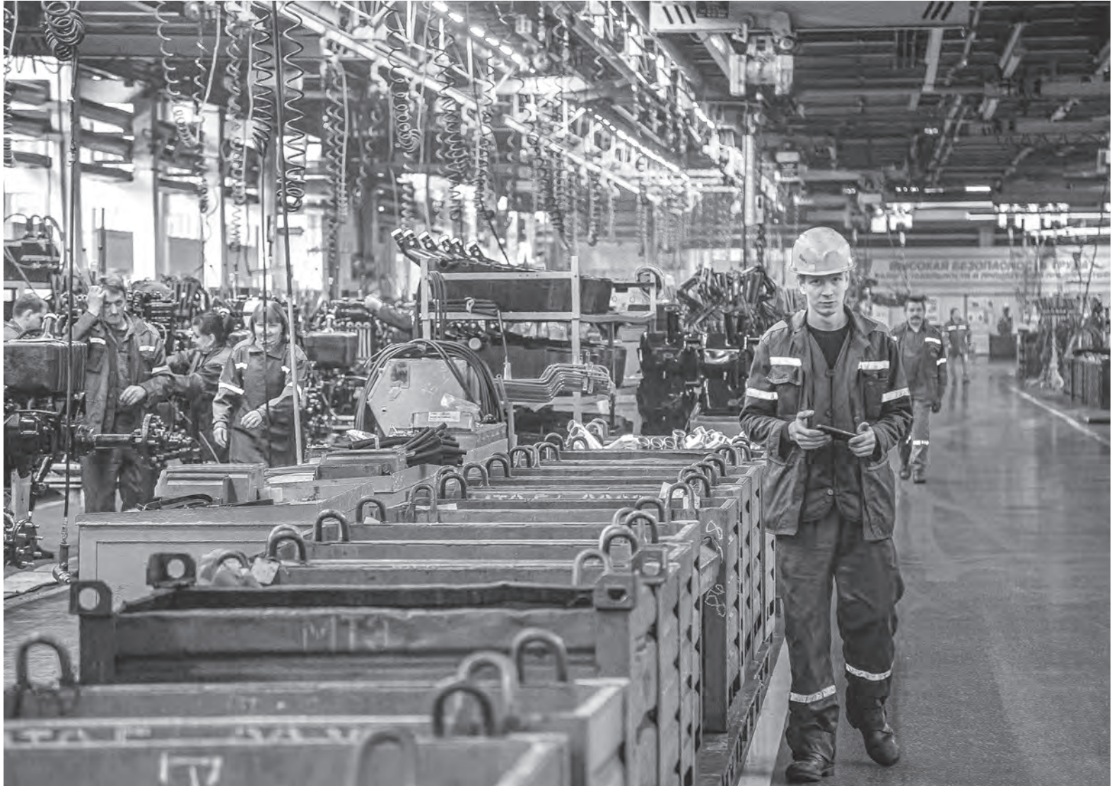
Фото носит иллюстративный характер.

Эти и другие вопросы прозвучали во время «прямой линии», которая была организована на базе Витебского обкома профсоюза работников здравоохранения.