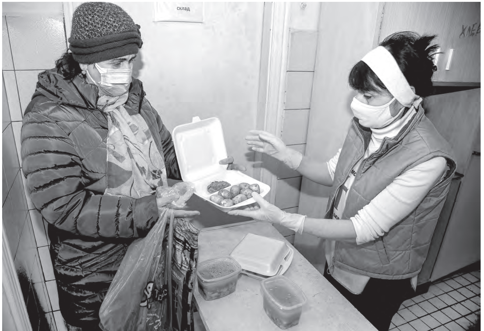
С продуктами для обедов «Табей» помогают местные предприятия и фермеры.

– Приблизительное меню составляется за неделю, и зависит оно от того, какие у нас есть продукты. Накормить нуждающихся помогают некоторые предприятия и фермеры. Более 20 лет от компании «Домочай» ежедневно получаем по 10 буханок белого и черного хлеба. Мясными продуктами обеспечивают агрокомбинат «Заря» и Могилевский мясокомбинат. Местные фермеры и сельхозпредприятия делятся картофелем, свеклой, морковью и другими овощами,