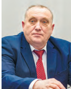
Василий ХВАТИК, председатель Белорусского профсоюза работников АПК

Что касается подкормки озимых культур, то и здесь темпы приличные. В лидерах: Брестский (78%), Минский (58%), Гродненский (57%) и Гомельский (31%) регионы. Идут работы по подкормке и обработке рапса.