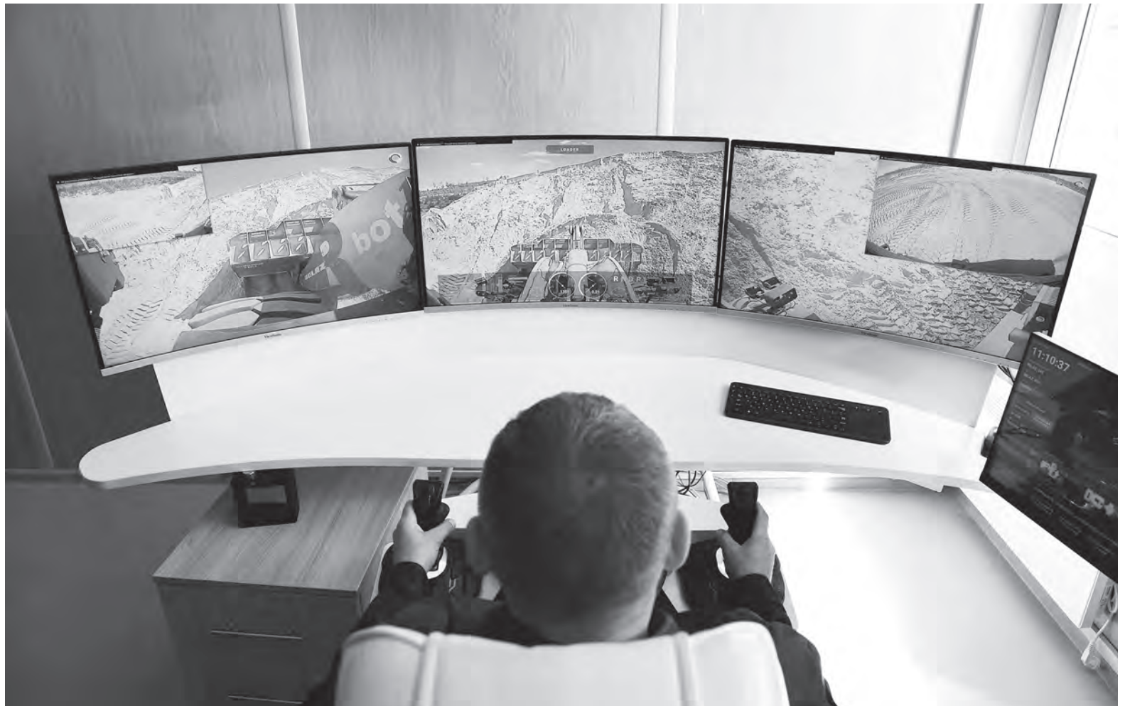
Оператор, управляющий беспилотным БелАЗом, на месторождении «Ситницкое» РУПП «Гранит».