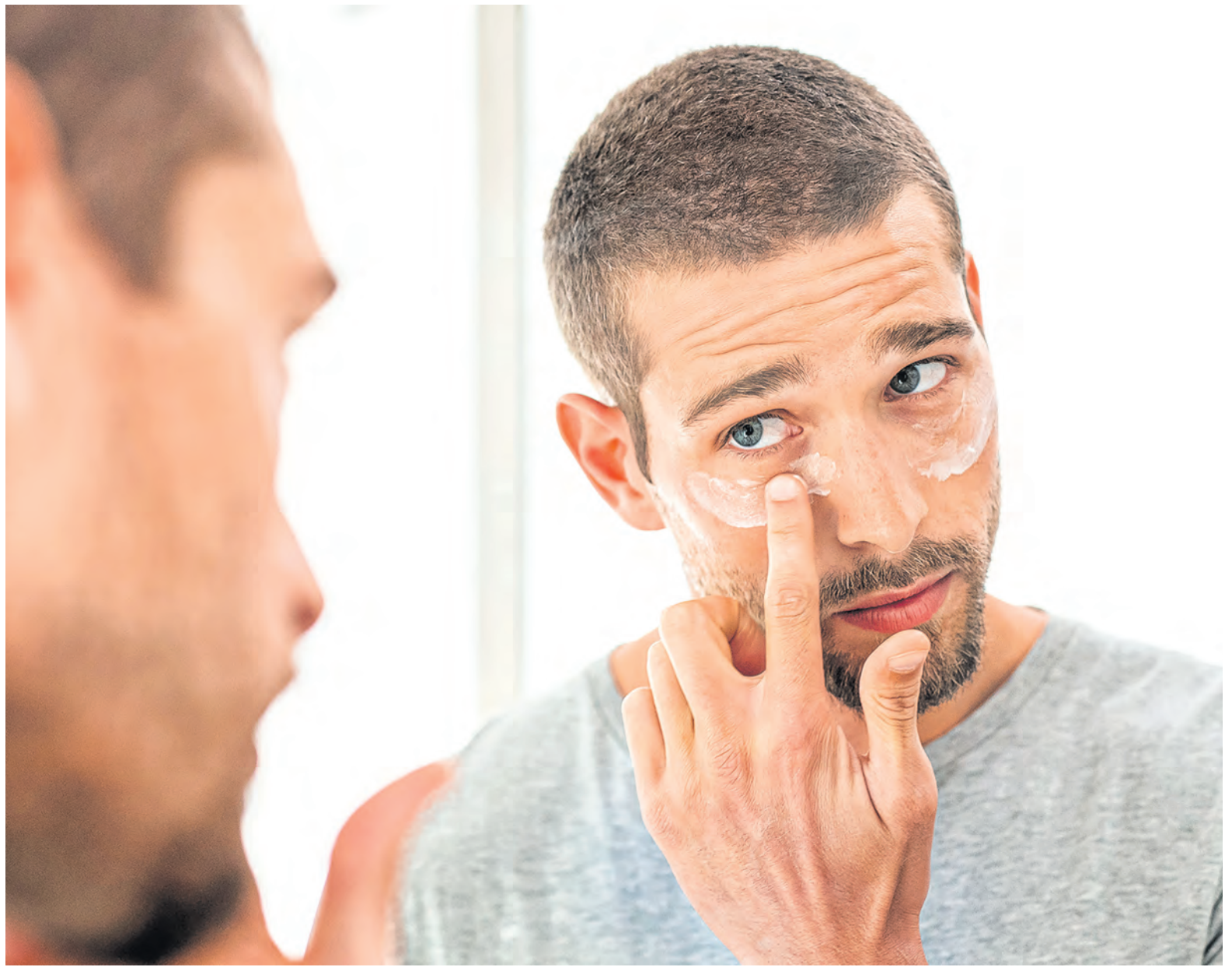
Фото носит иллюстративный характер.

Для увлажнения кожи надо в первую очередь нормализовать питьевой режим – употреблять достаточное количество чистой воды. Благоприятный микроклимат для кожи позволяют создать увлажняющие кремы, маски